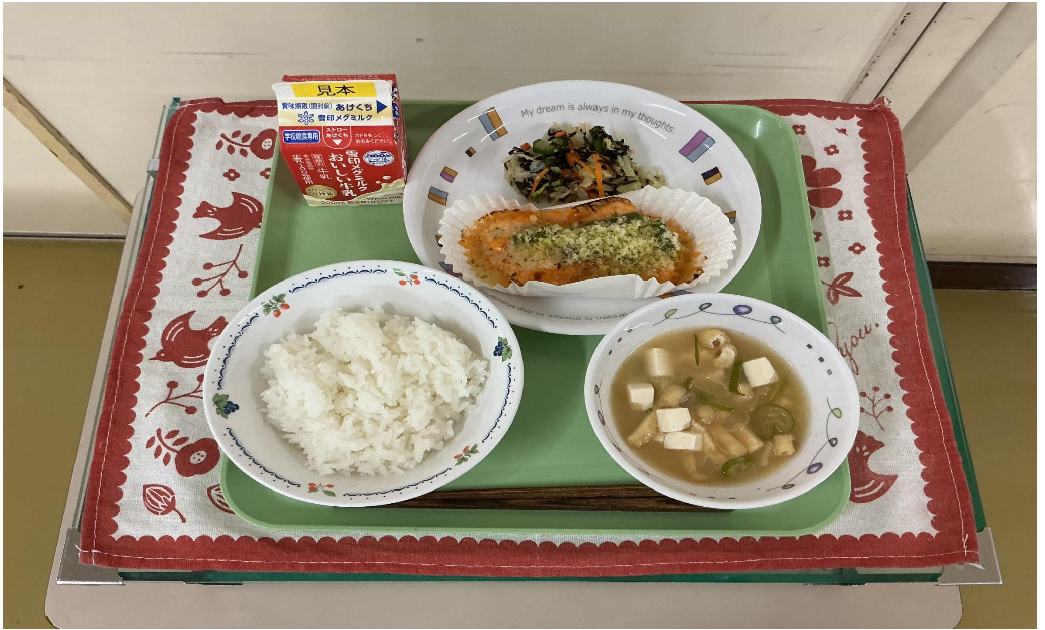
ごはん、 とり 鶏むね肉の にく ケチャマヨ だいごや 醃酏焼き、 とうふ のりサラダ、 あぶらあ 豆腐と しる 油揚げのみそ汁