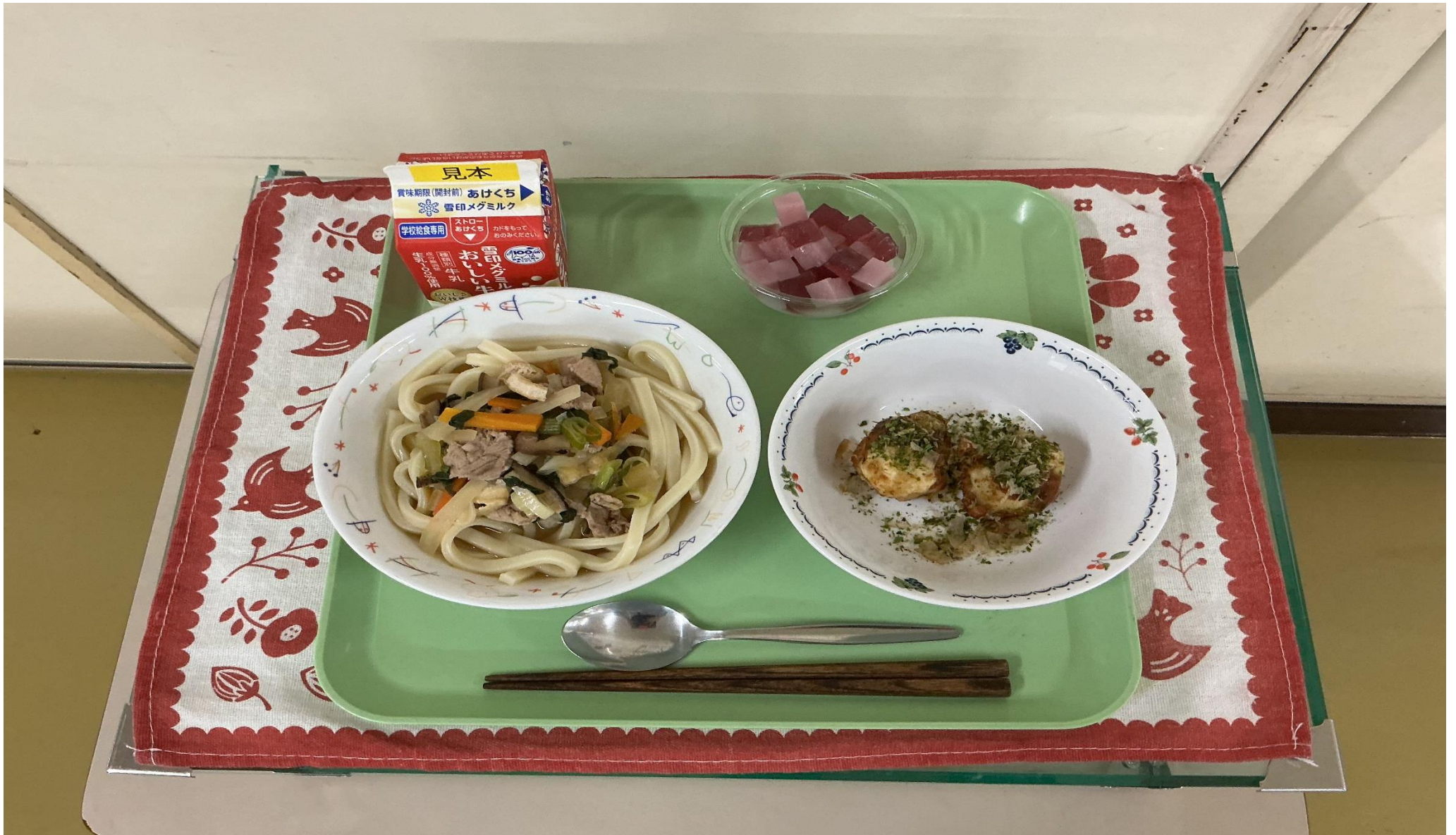
ごもく 五目うどん、たこ焼きポテト、あじさいゼリー