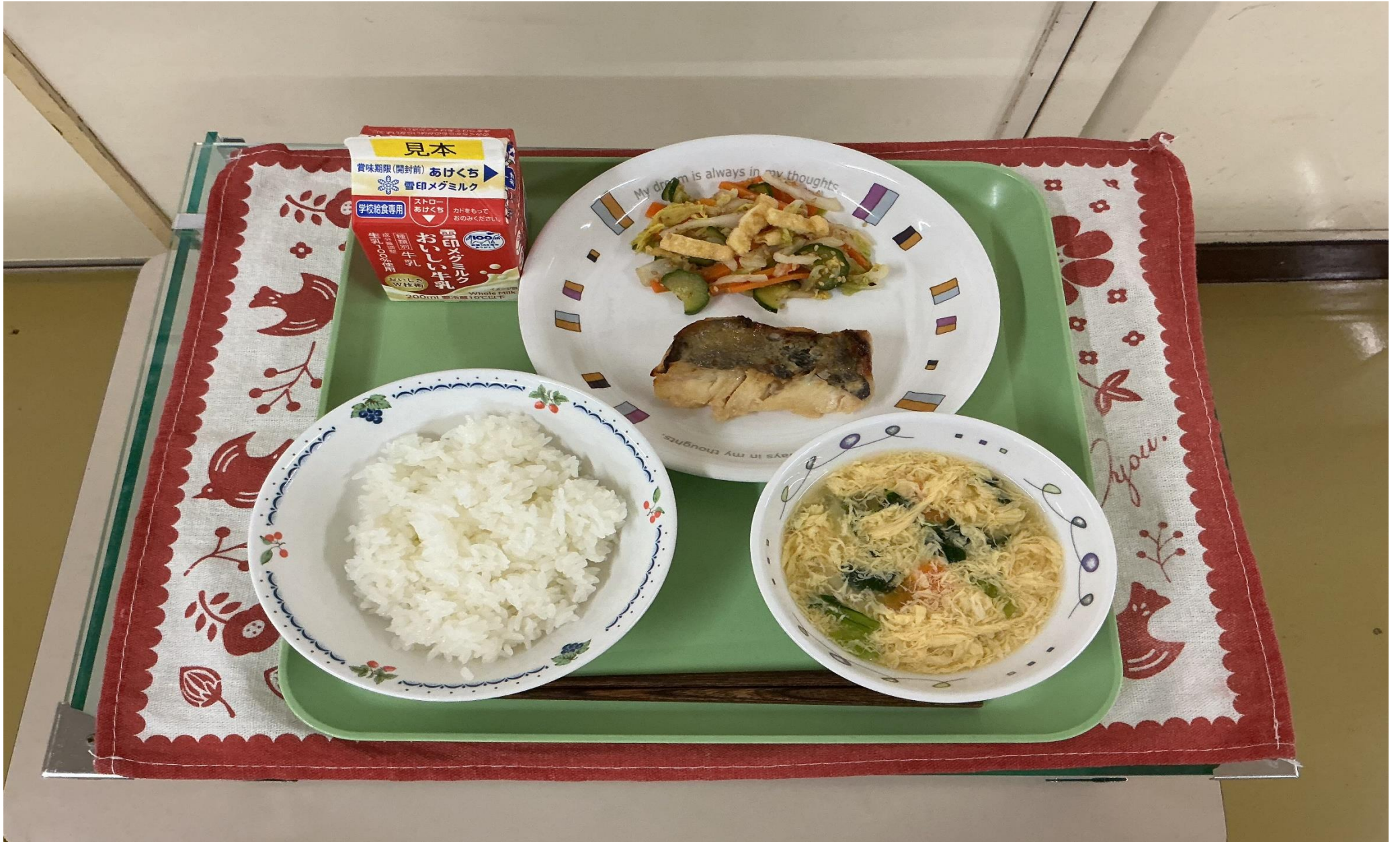
ごはん、ホキの西京焼き、白菜と油揚げのかりかりサラダ、卵と野菜のすまし汁