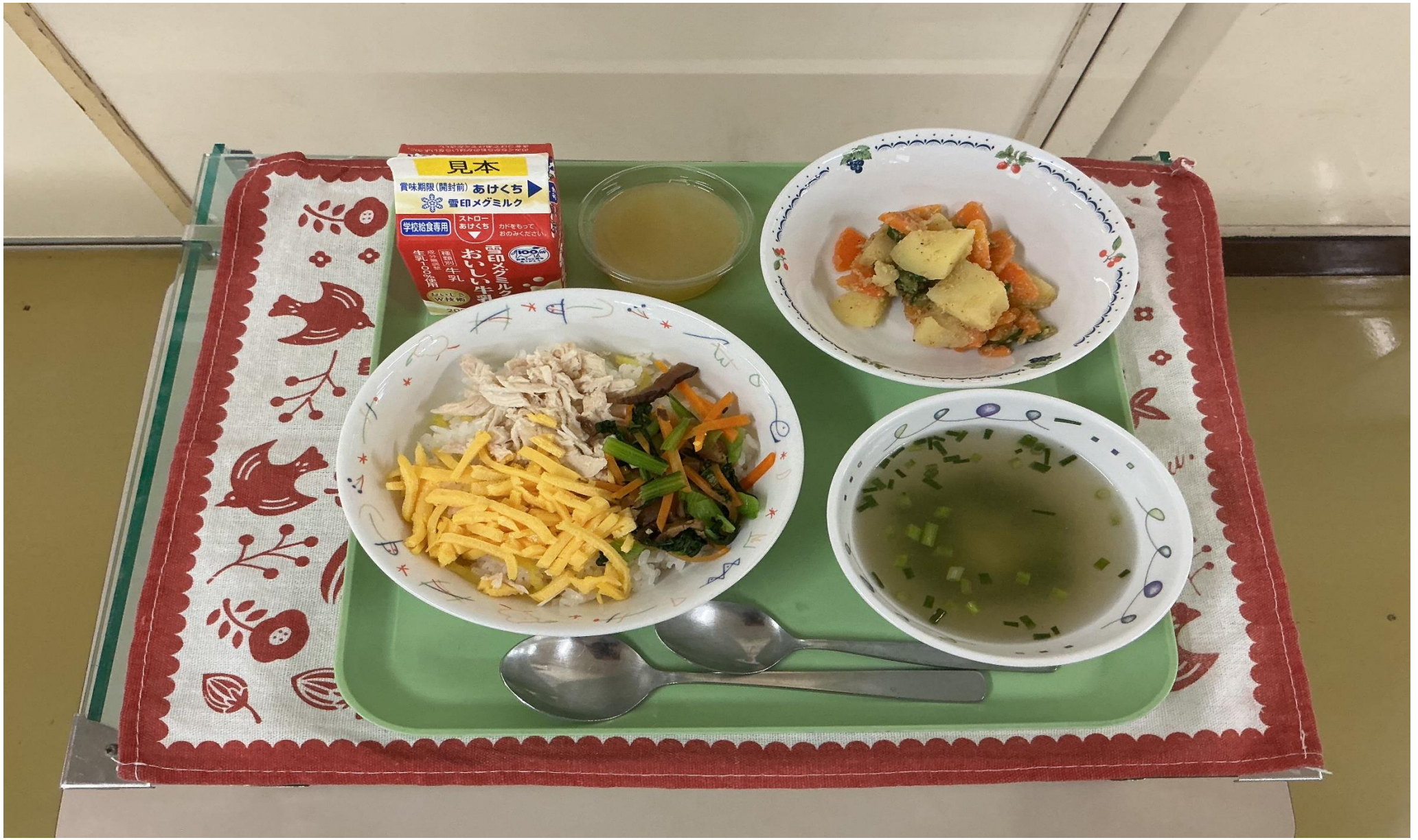
けいはん とり わふう 鶏飯、鶏がらスープ、和風ポテトサラダ、パインゼリー