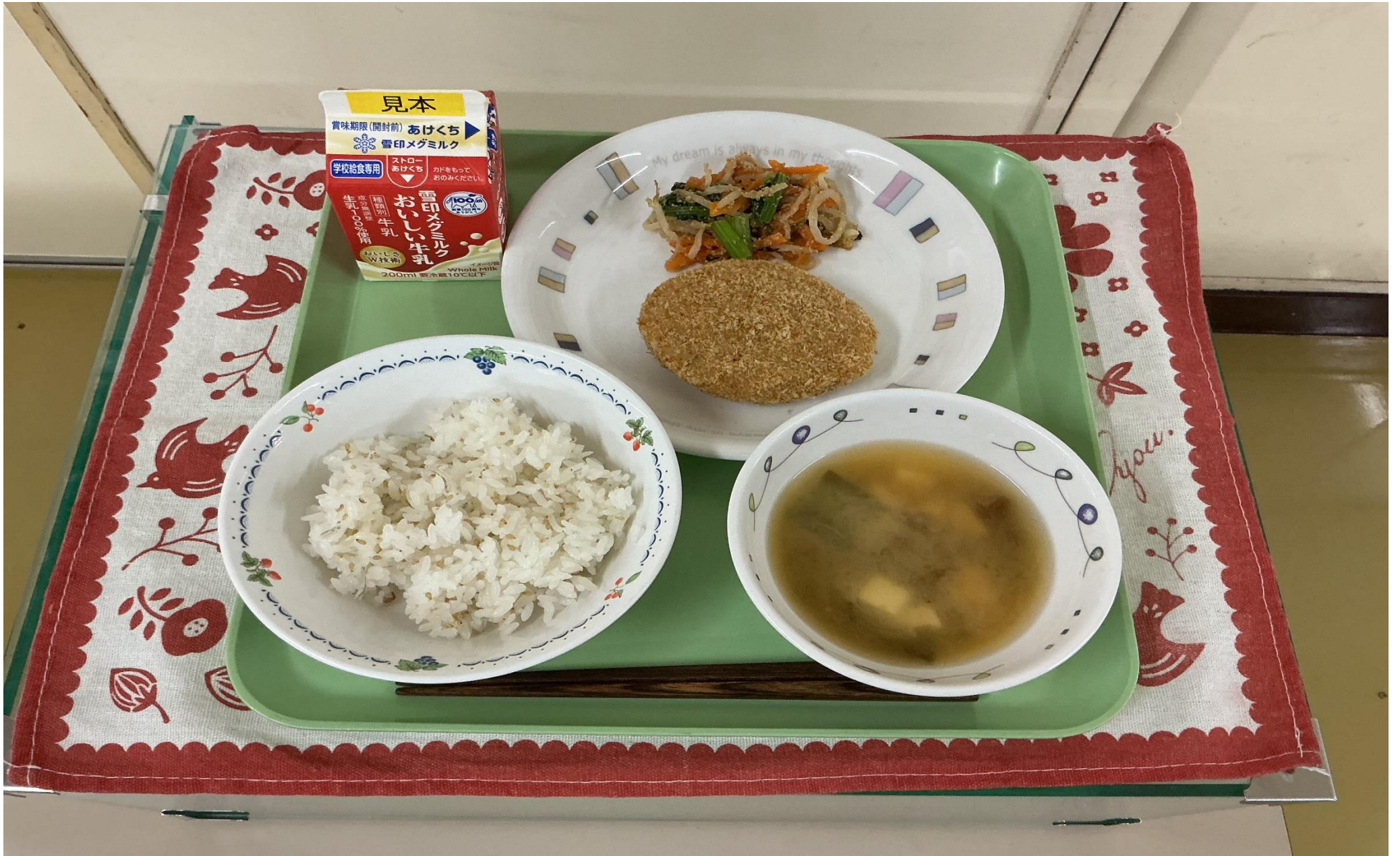
じゃこごまごはん、肉 にく じゃがコロッケ、もやしのごま すあ 酢和え、なめこのみそ汁 しる