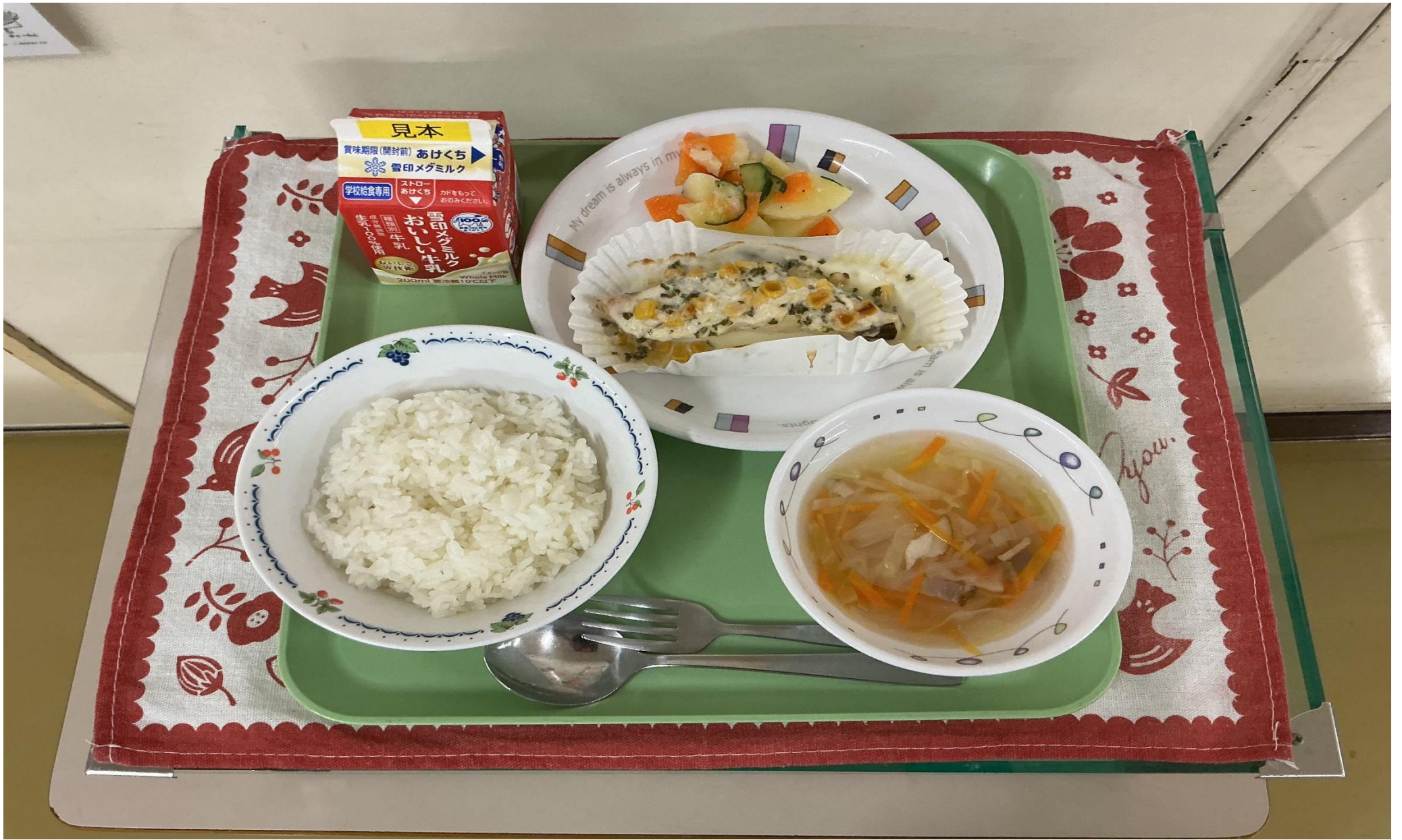
バターライス、 しろみざかな 白身魚の や マヨネーズ焼き、ポテトのバジルサラダ、ジュリアンスープ