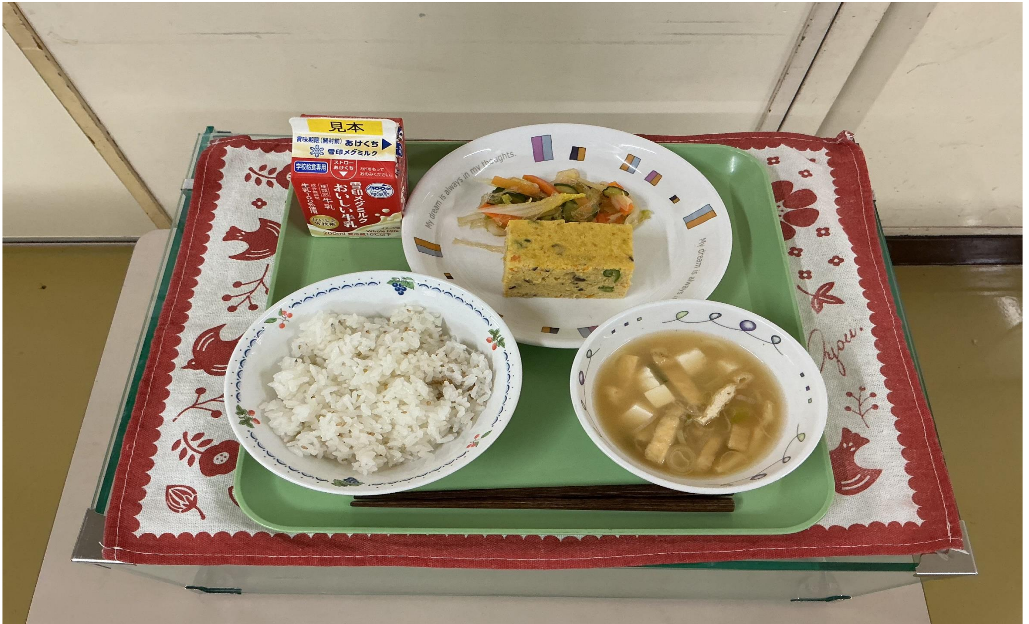
ぐ だくさんあつ や いと かんてん わ ふう とう ふう あ ぶら あ しる じゃ こと ごと ま ごと はん、 具 沢 山 厚 焼 き た ま ごと、 糸 寒 天 の 和 風 サ ラ ダ、 豆 腐 と 油 揚 げ の み そ 汁