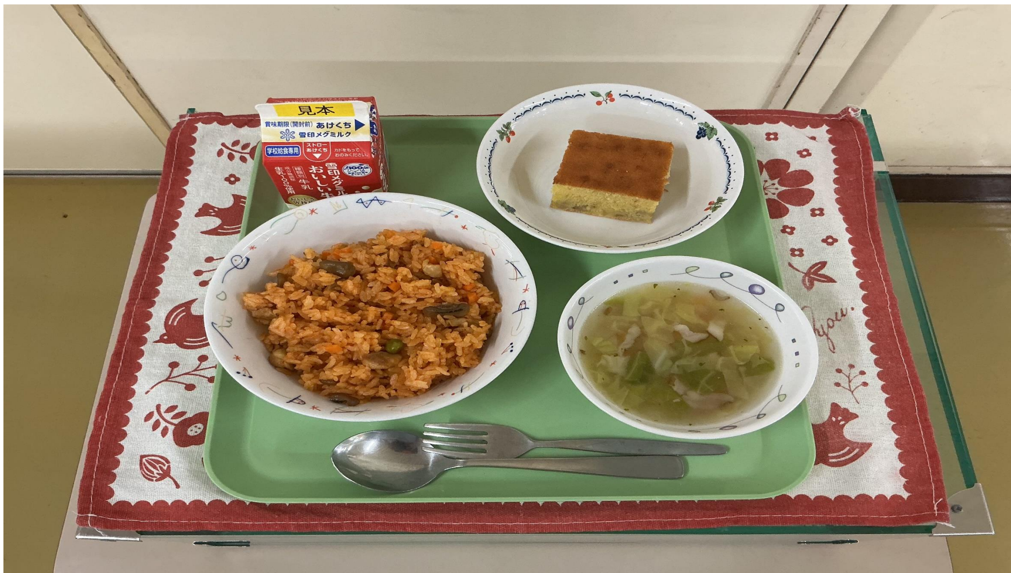
チキンライス、 はるやさい 春野菜スープ、バナナケーキ