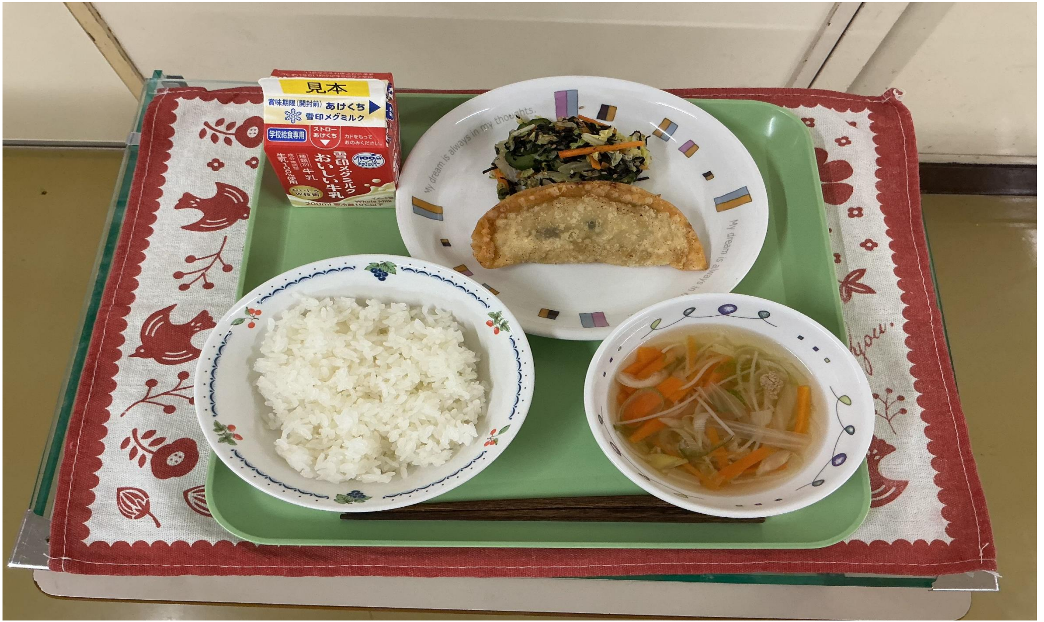
ごはん、ジャンボあげぎょうざ、のりサラダ、ビーフンスープ