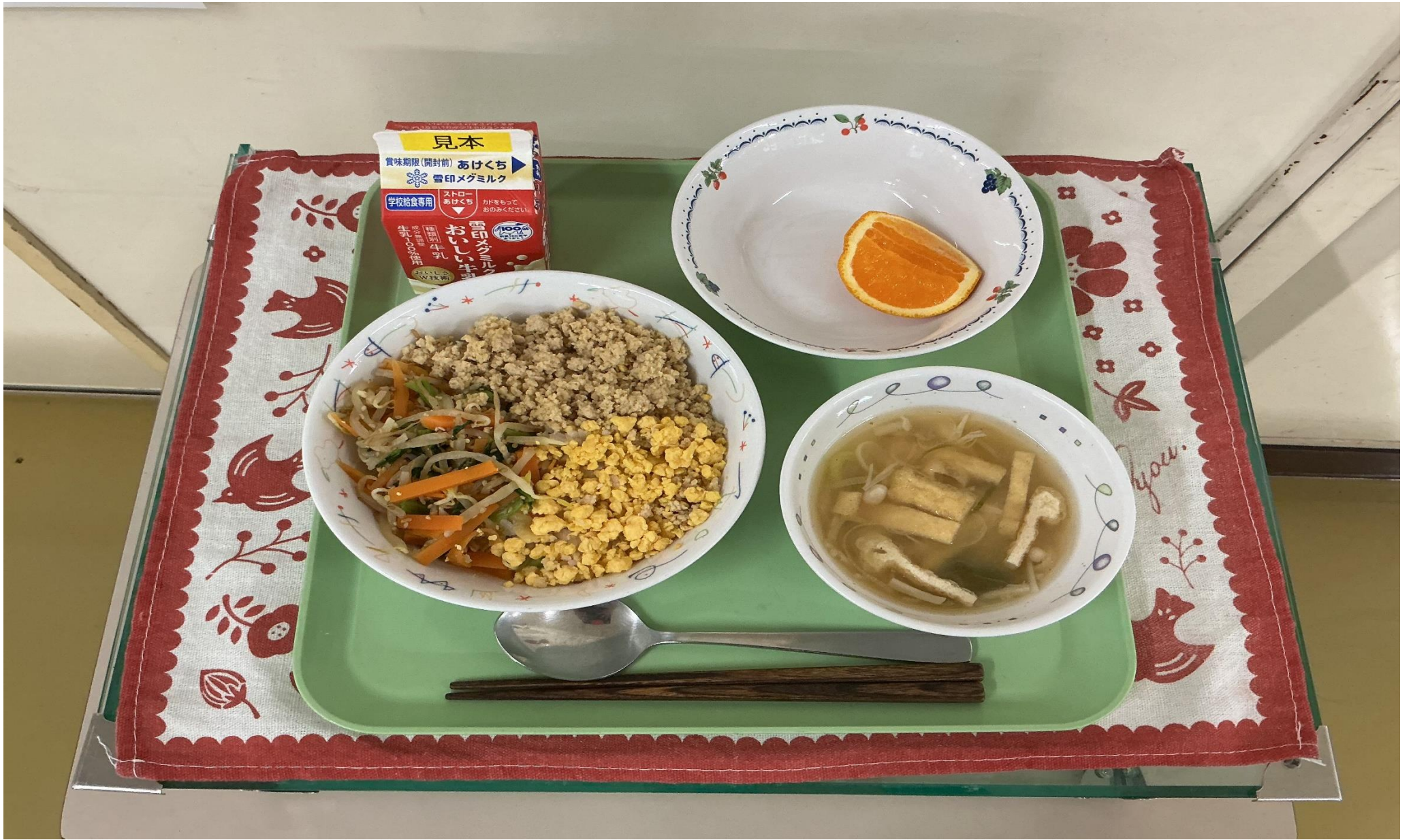
さんしょく どん あぶら あ しる くだもの きよみ 三色そぼろ丼、えのきと油揚げのみそ汁、果物(清見オレンジ)