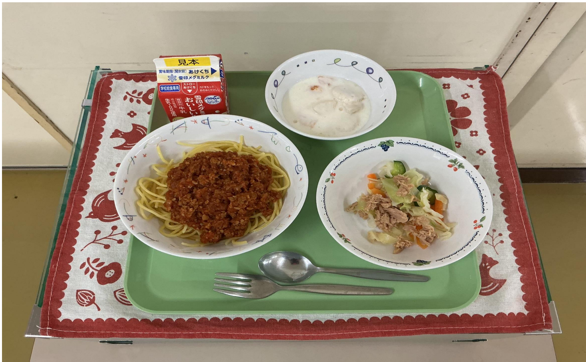
ミートスパゲッティ、ツナとキャベツのサラダ、フルーツヨーグルト