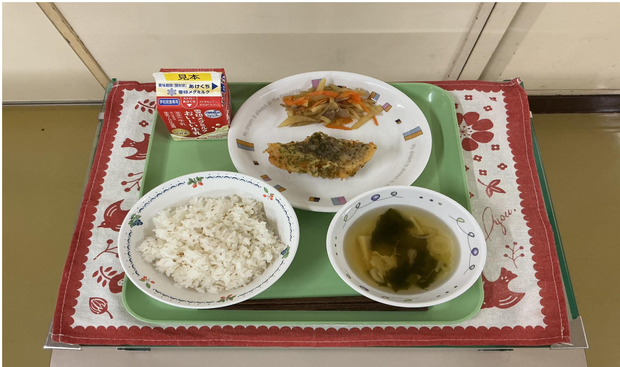
じゃこごまごはん、 さかな 魚の わかくさ 若草あげ、 いも じゃが芋のきんぴら、 わかたけじる 若竹汁