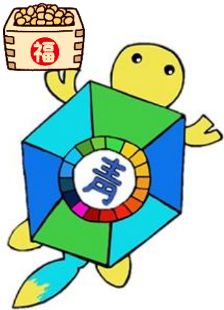
150 周年マスコットキャラクター 『チャートルン』