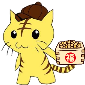
いじめゼロプロジェクトから うまれたキャラクター 『ゼロっち』