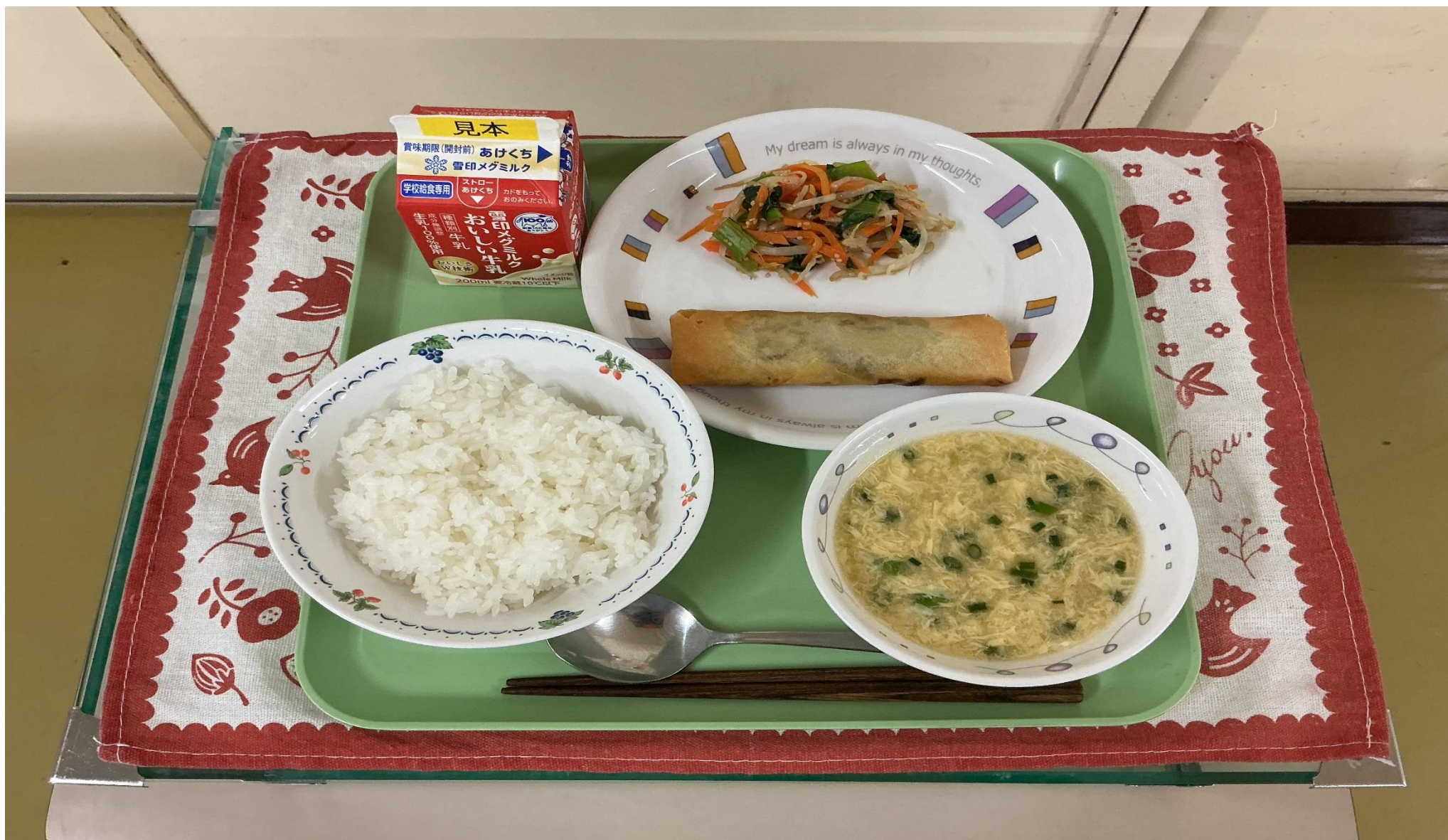
ごはん、 はるま 春巻き、ナムル、 ちゅうかう 中華風コーンスープ