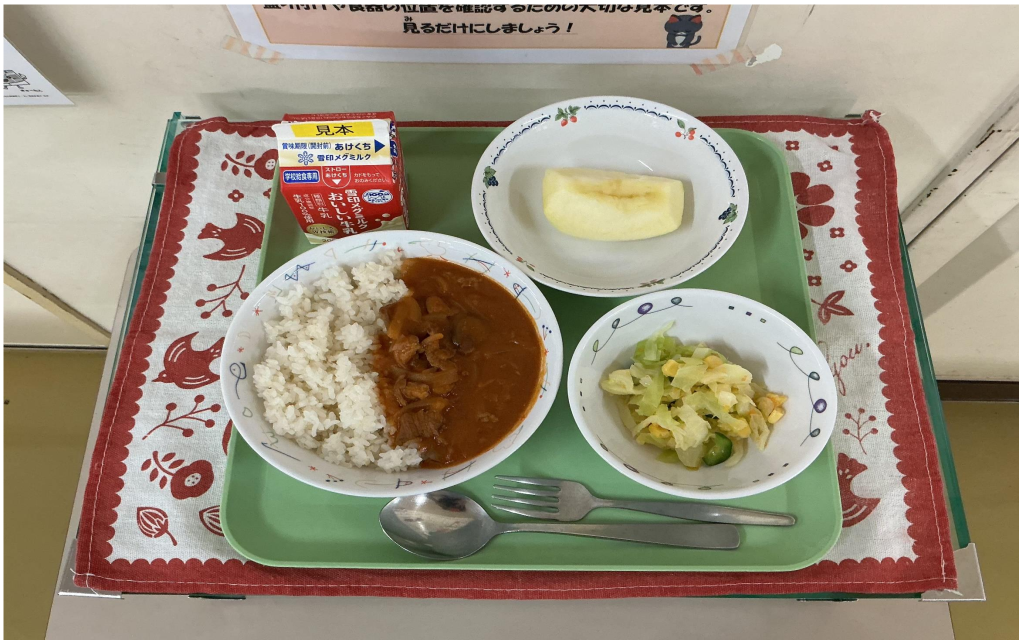
バターライス ハッシュドポーク、キャロットドレッシングサラダ、 くだもの 果物(りんご)