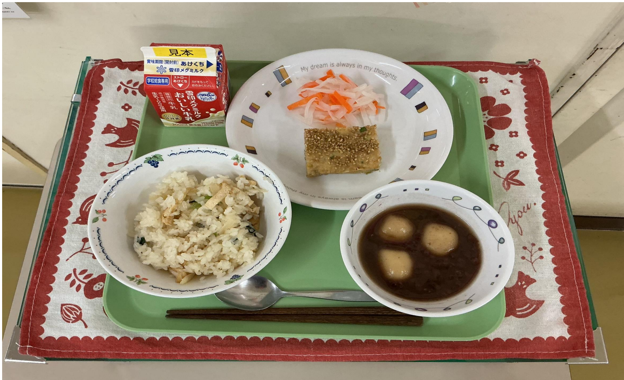
すずしろごはん、 まつかぜ や 松風焼き、 こうはく 紅白なます、 しらたまだ んど 白玉団子のお汁粉 しるこ