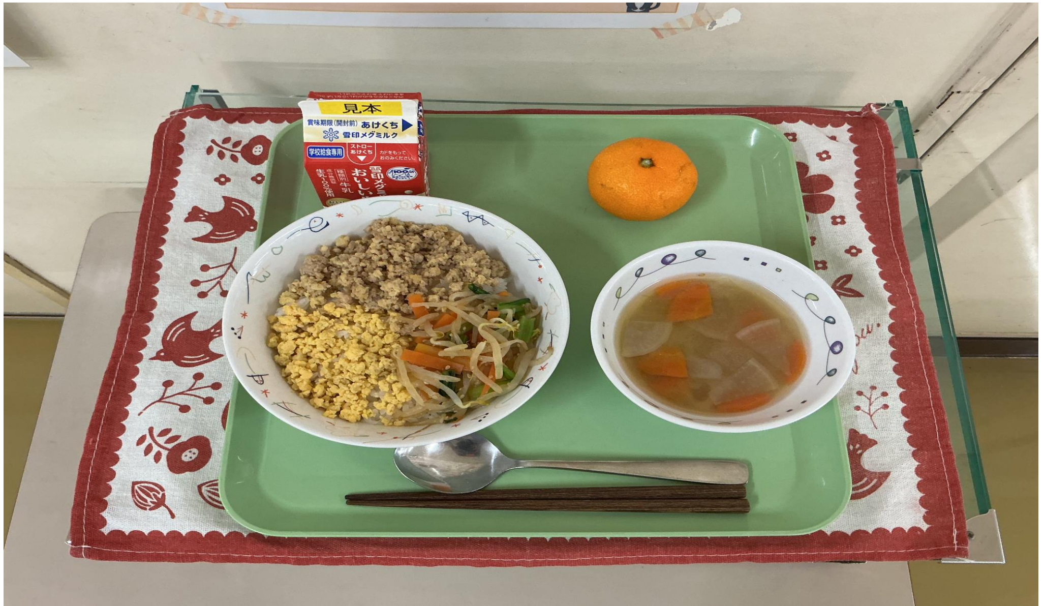
さんしょく どん こんさい しる くだもの 三色そぼろ丼、根菜みそ汁、果物(みかん)