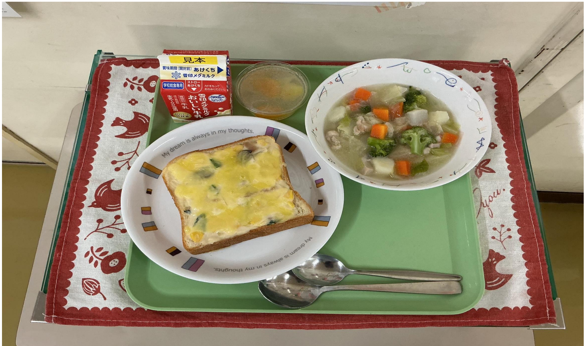
グラントースト、ゴロゴロ やさい 野菜ポトフ、フルーツサイダーゼリー