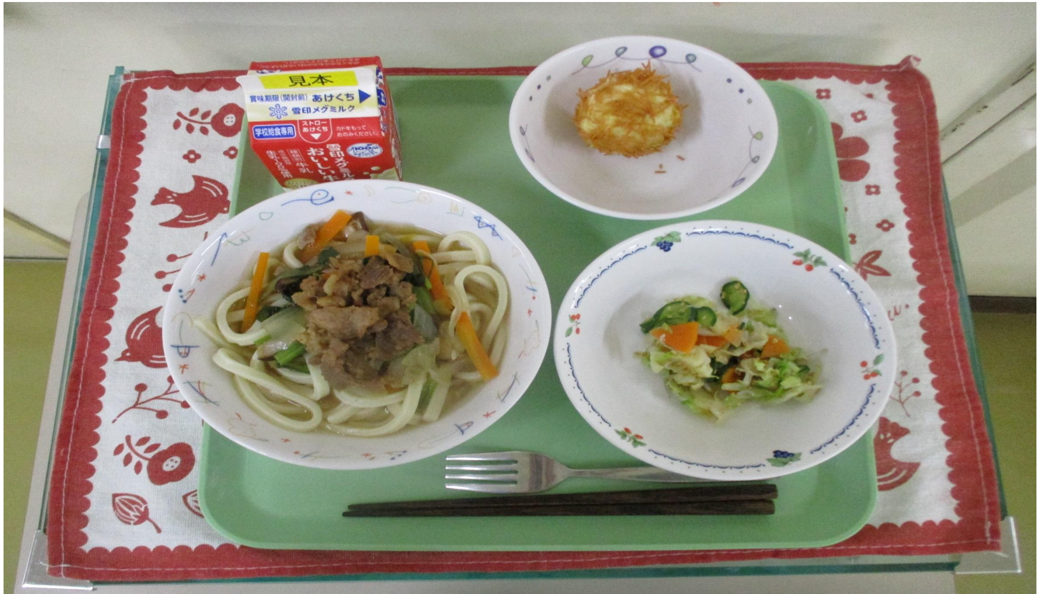
にく 肉うどん、じゃこサラダ、いがぐり あ 揚げ