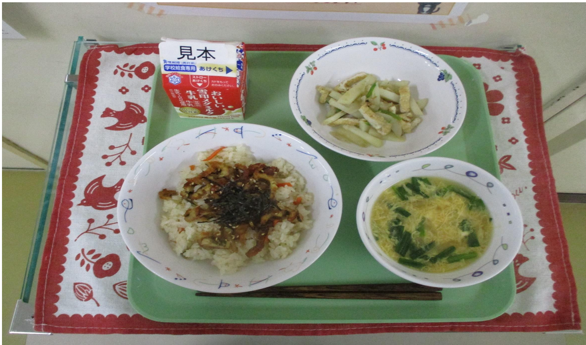
あなごめし、じゃが芋 いも の和風炒め、たまごのみそ汁 しる