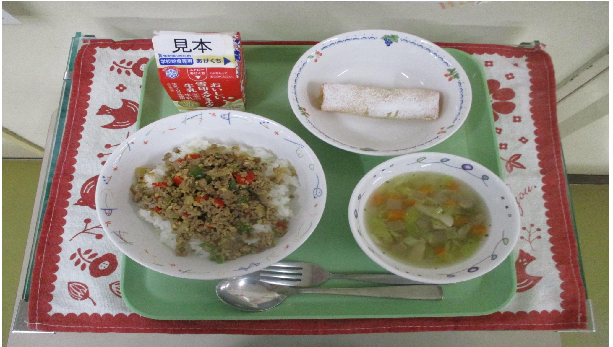
ガパオライス、 やさしい 野菜スープ、バナナルンピア