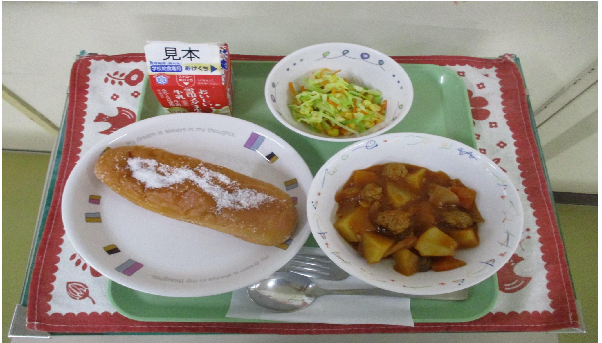
あ 揚げパン、ミートボールのトマトシチュー、コールスローサラダ