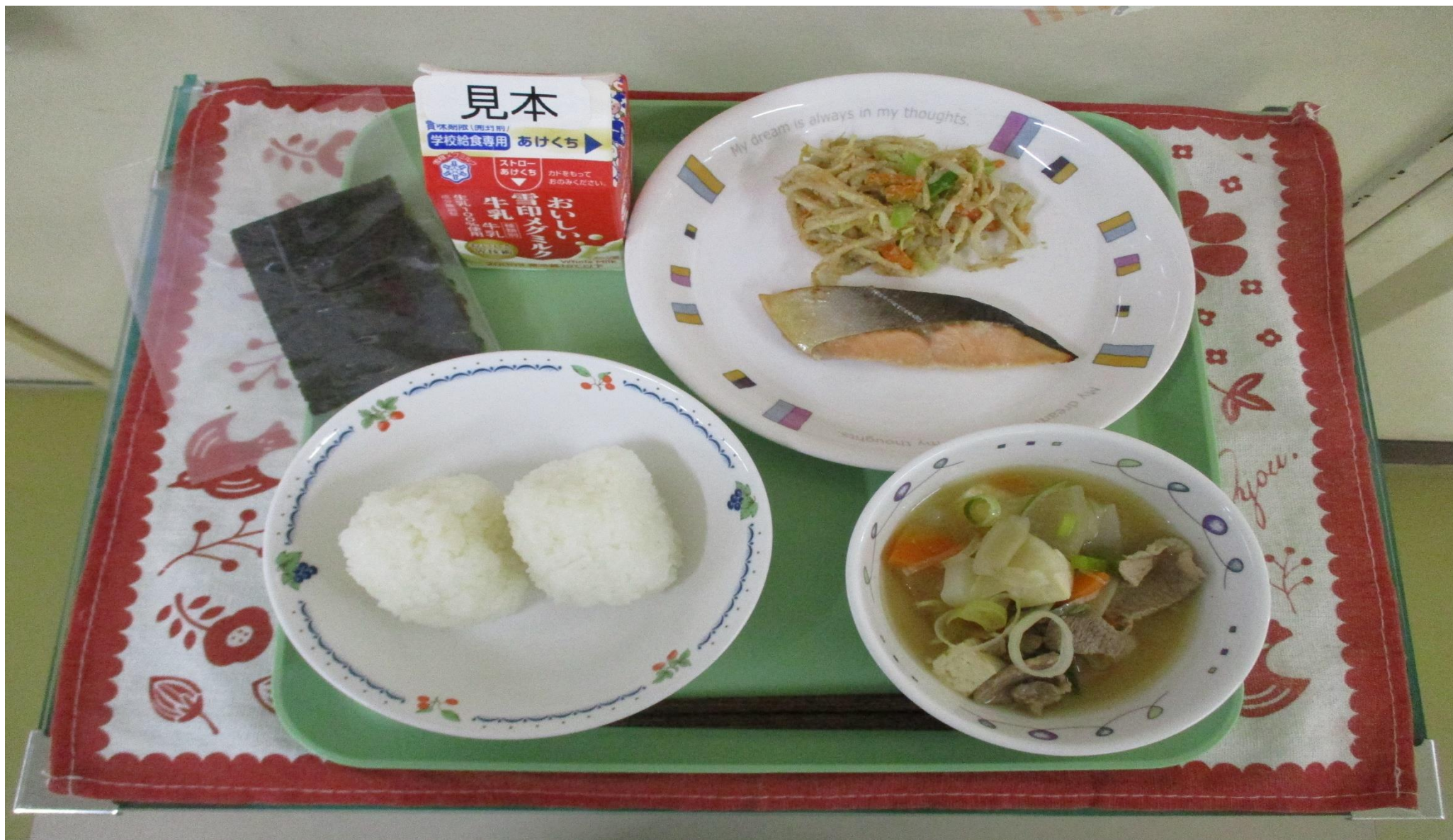
おにぎり、 さけ 鮭の塩麴焼き、 あ ごま和え、 とんじる 豚汁