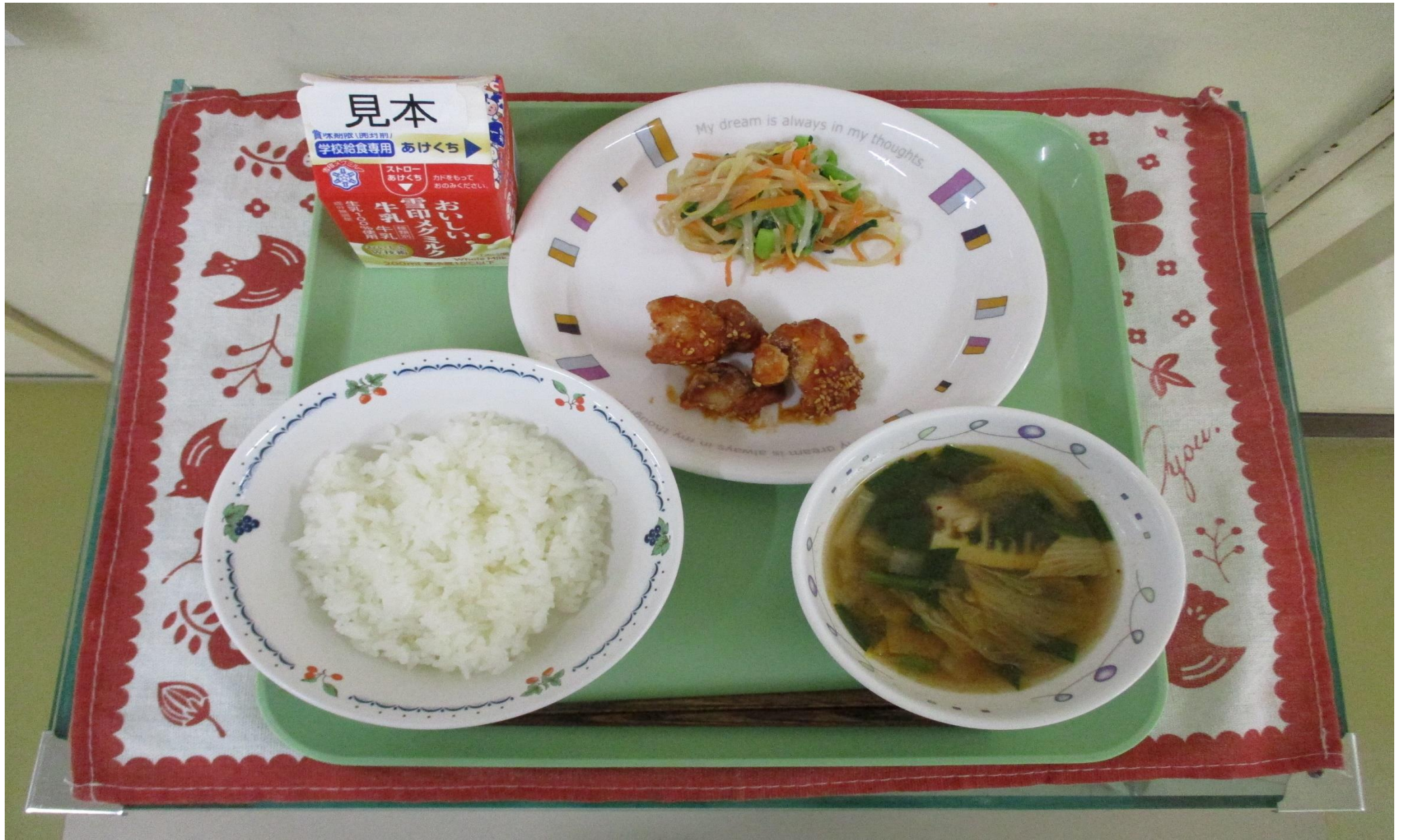
ごはん、ヤンニヨムチキン、ナムル、キムチスープ