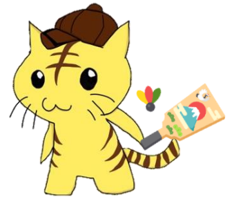
いじめゼロプロジェクトから うまれたキャラクター 『ゼロっち』