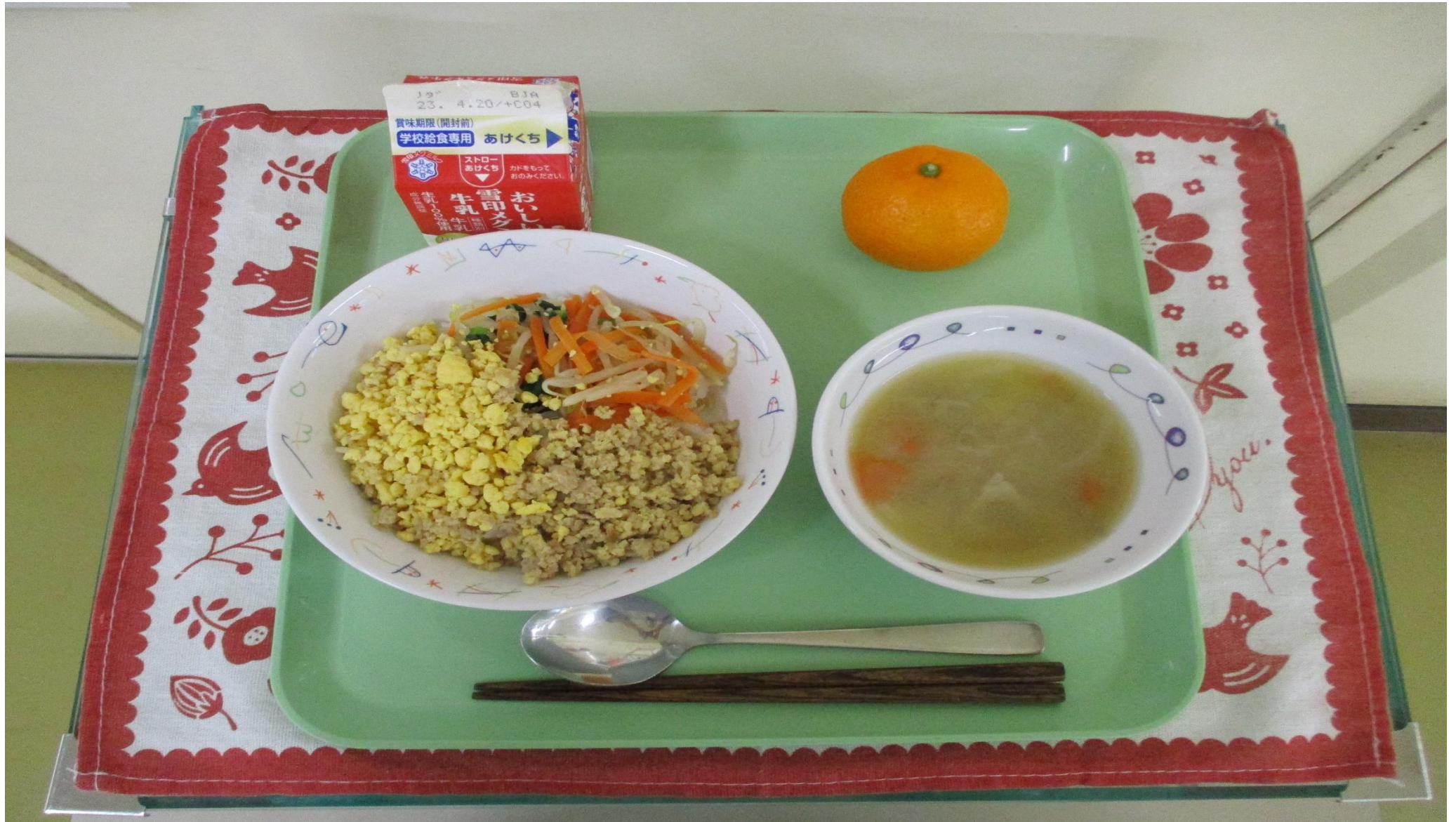
さんしょく どん こんさい しる くだもの 三色そぼろ丼、根菜みそ汁、果物(みかん)