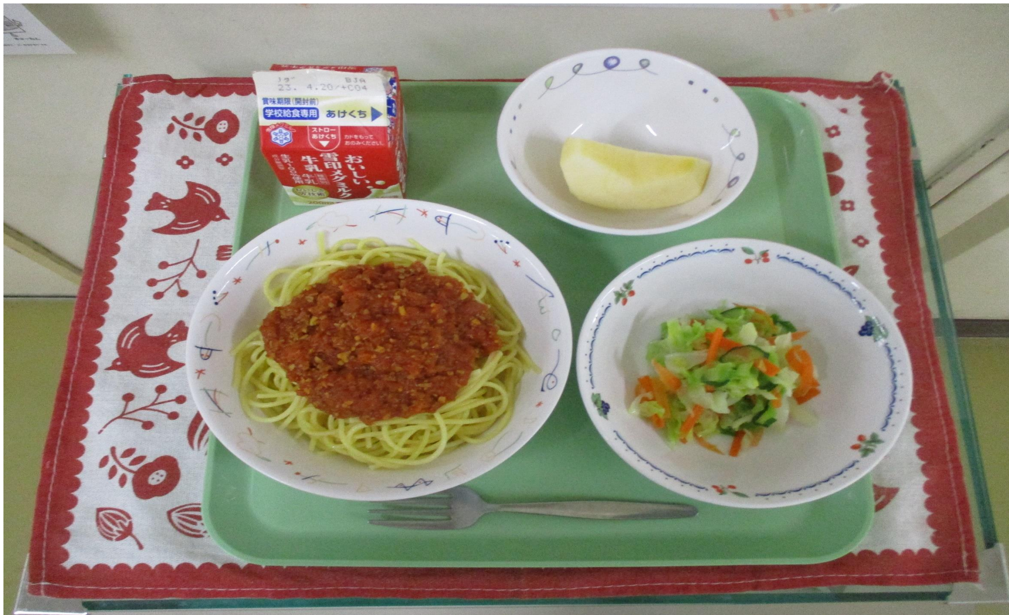
ミートスパゲッティ、フレンチサラダ、 くだもの 果物(りんご)