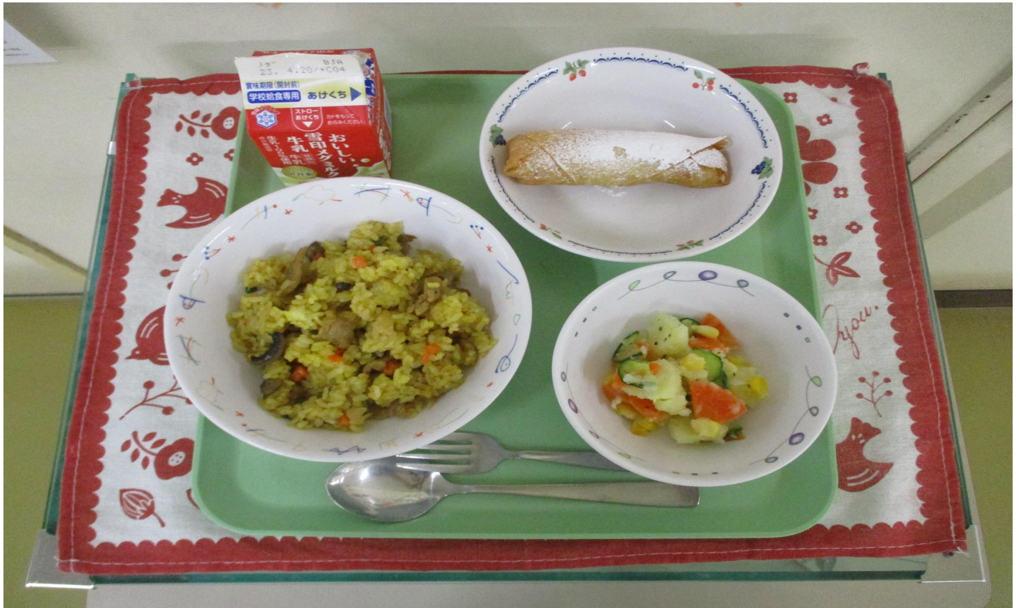
カレーピラフ、ポテトのバジルサラダ、バナナルンピア