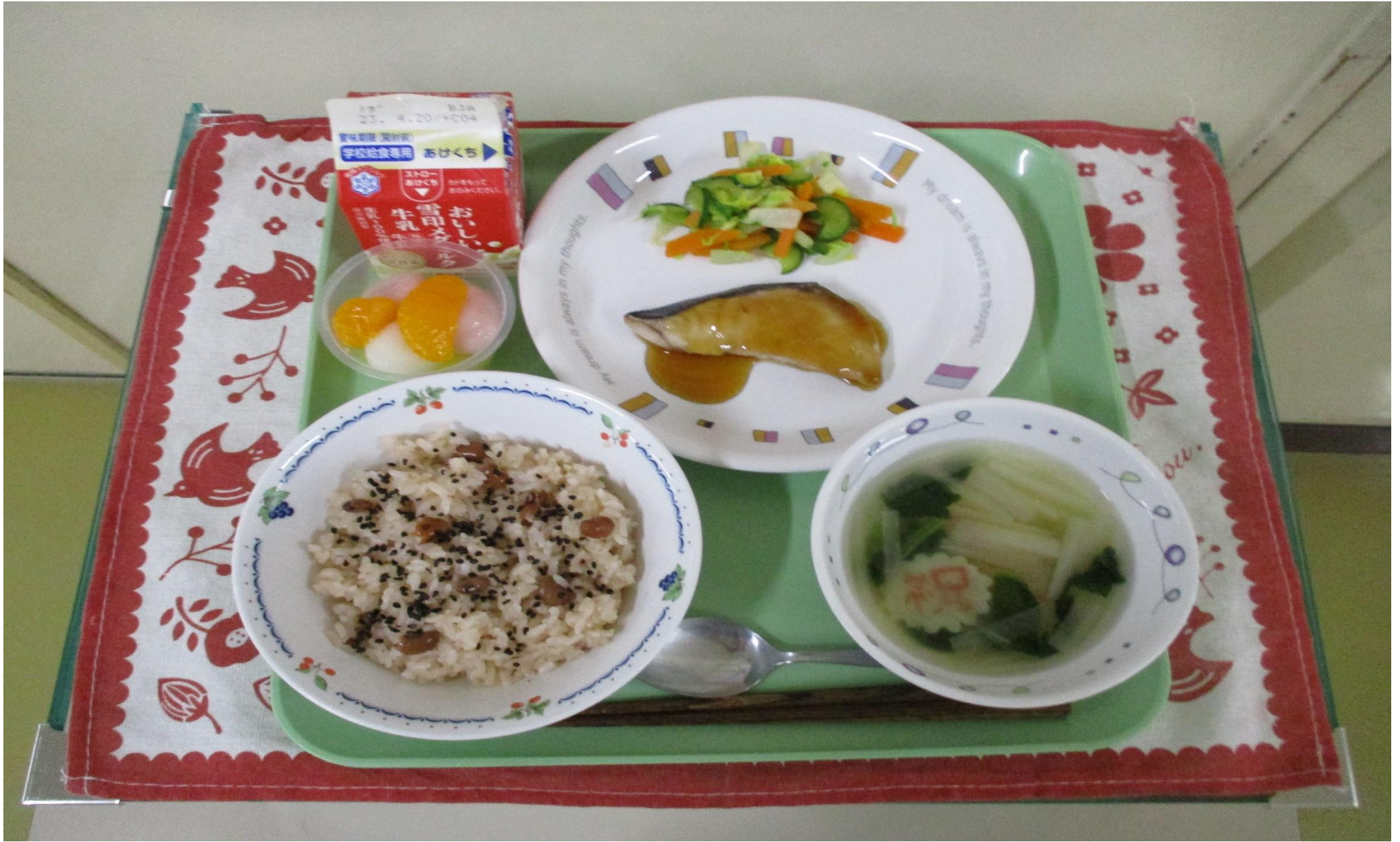
せきはん て や はくさい す じる こうはくだんご 赤飯、ぶいの照り焼き、白菜のゆずポン酢がけ、すまし汁、紅白団子のフルーツポンチ