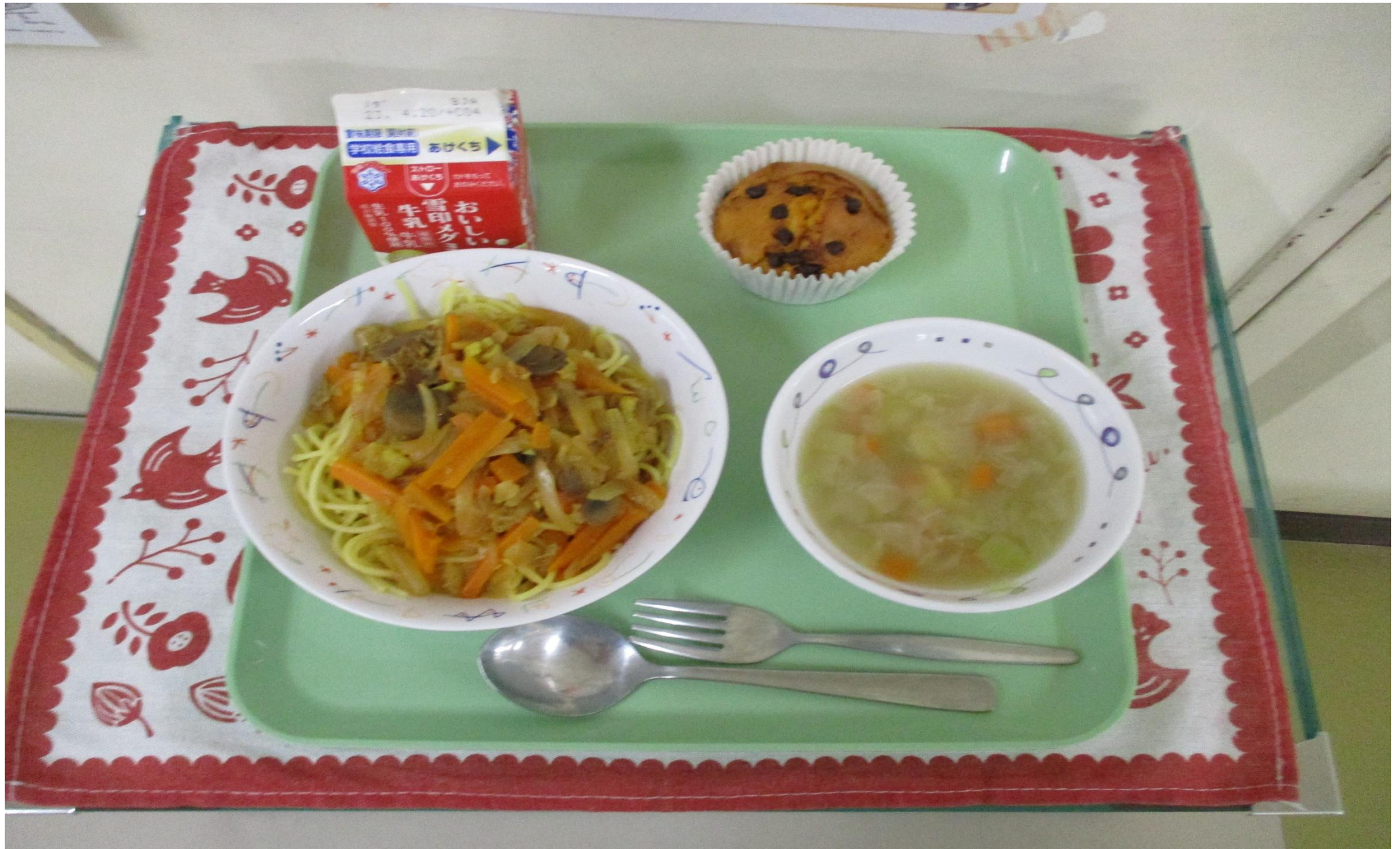
スパゲッティオリエンタルソース、野菜スープ、かぼちゃのカップケーキ