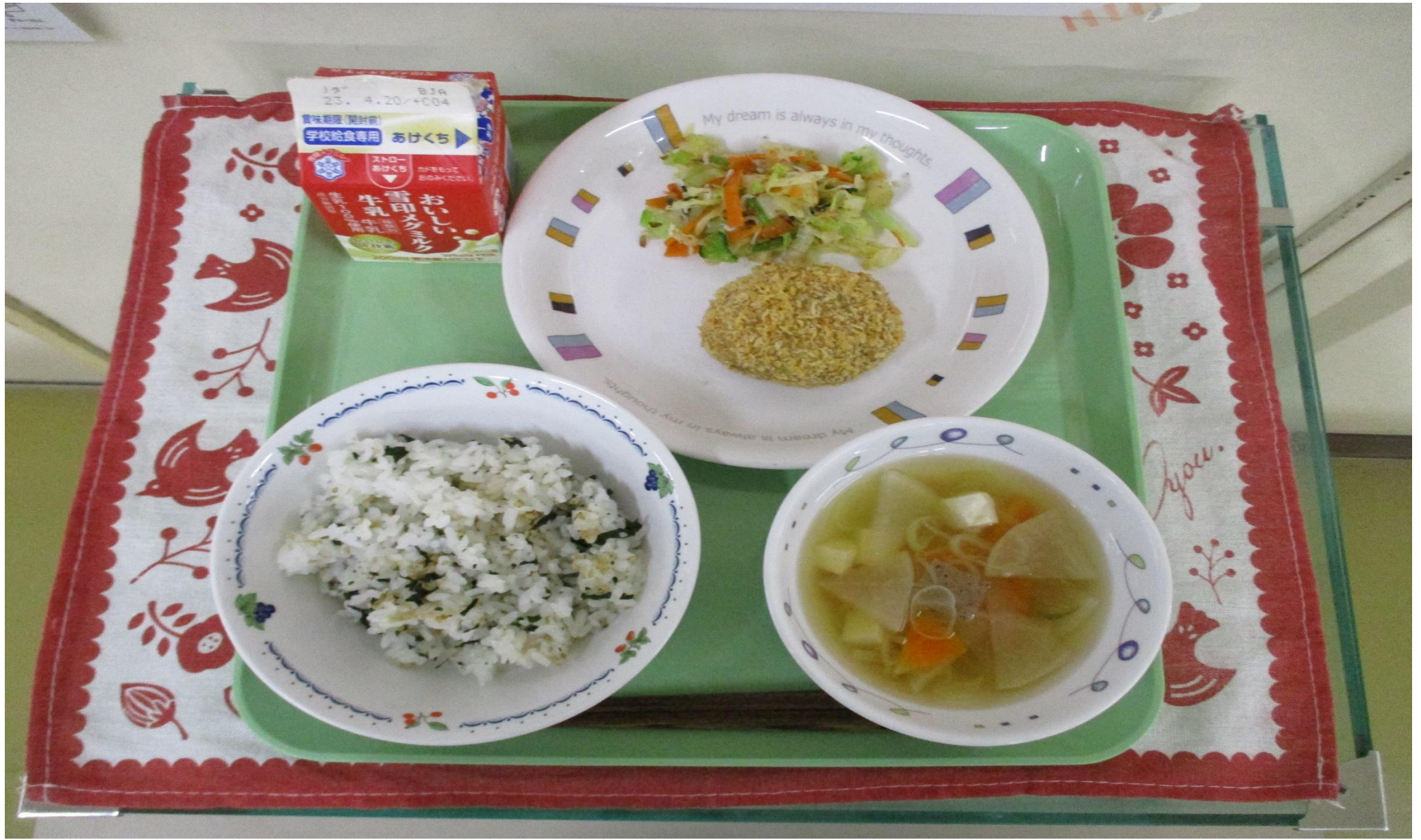
にく にく わかめごはん、肉じゃがコロッケ、しらすと野菜のおかか和え、けんちん汁 じる