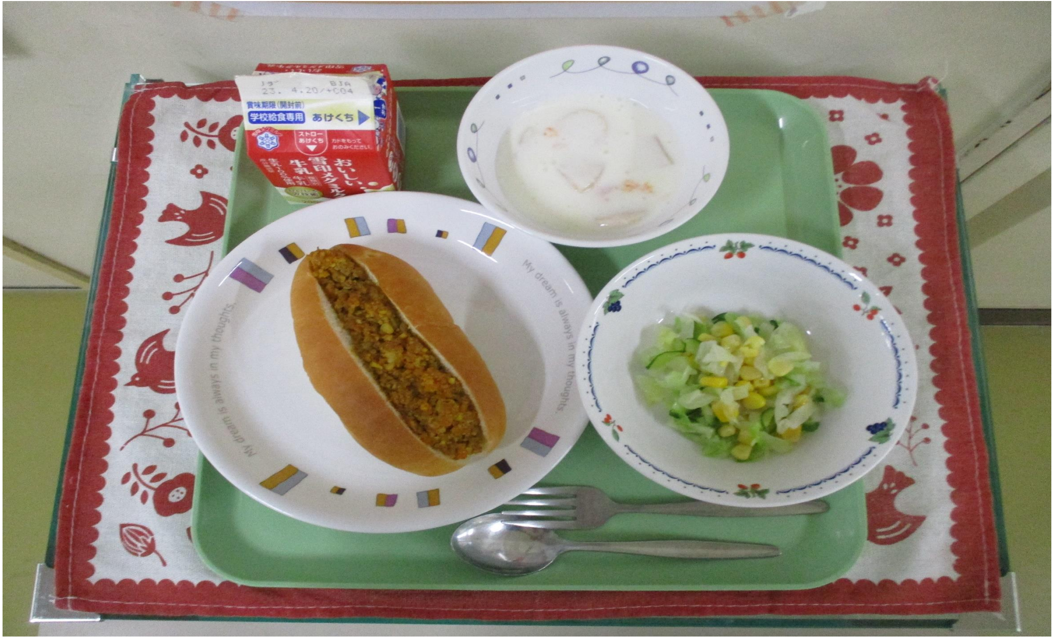
カレーミートドック、コーンサラダ、フルーツヨーグルト