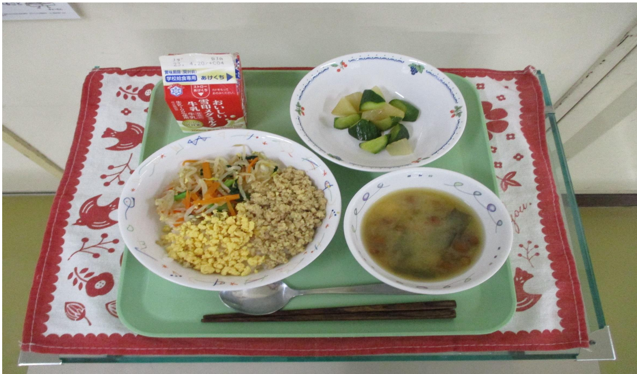
さんしょく どん だいこん ちゅうか あ しる 三色そばろ丼、きゅういと大根の中華和え、なめこのみそ汁