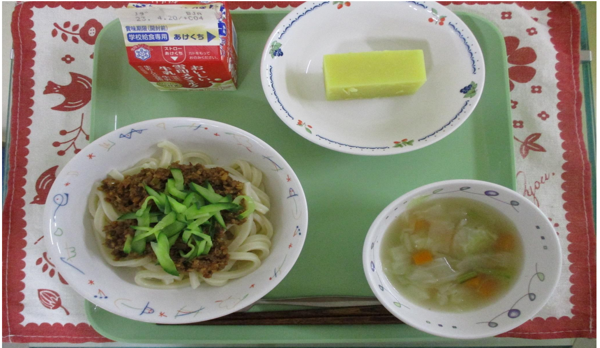
もいおか 盛岡じゃじゃめん、 やさい 野菜スープ、いもようかん