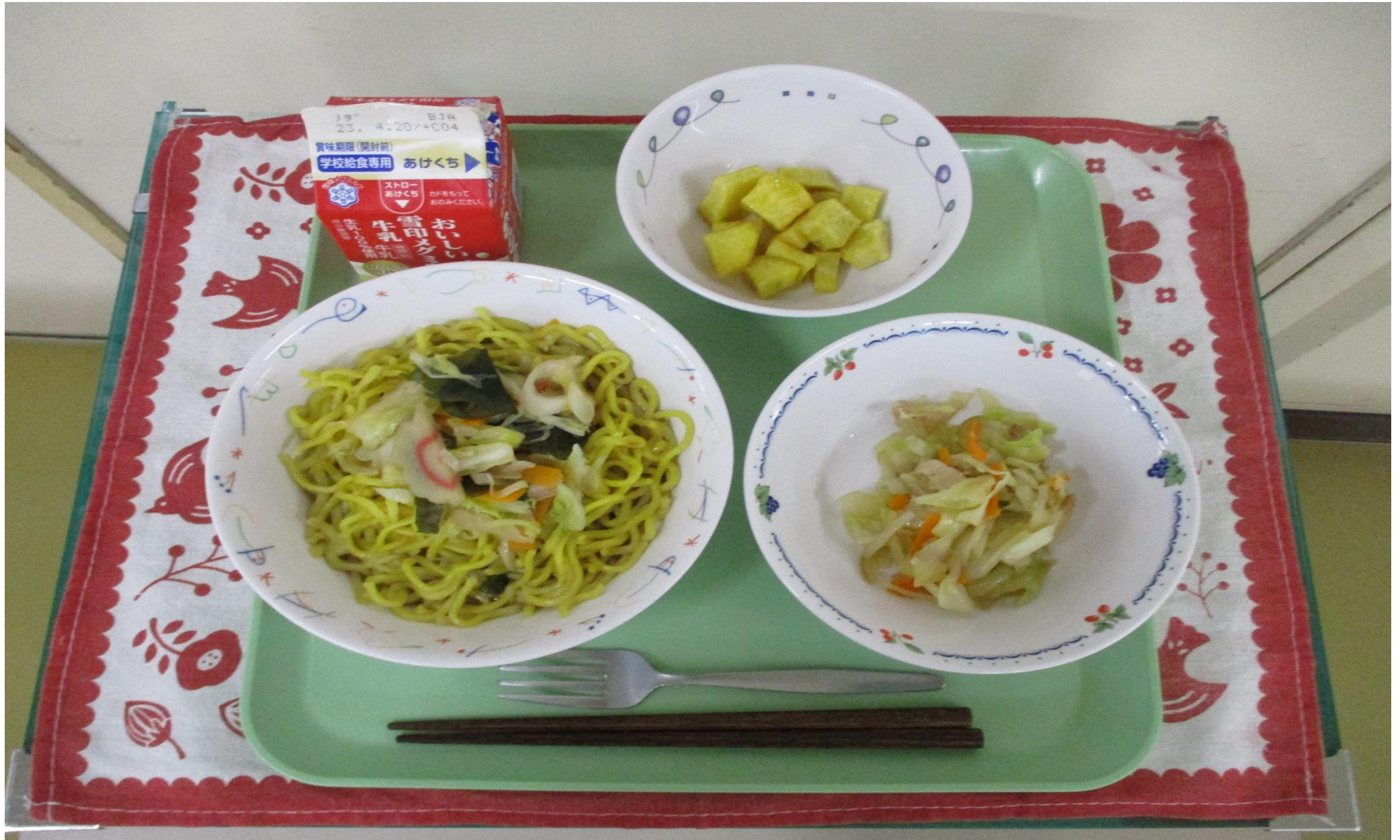
しょうゆラーメン、 やさい 野菜のオイスターソース炒め、 いた キャンディーポテト