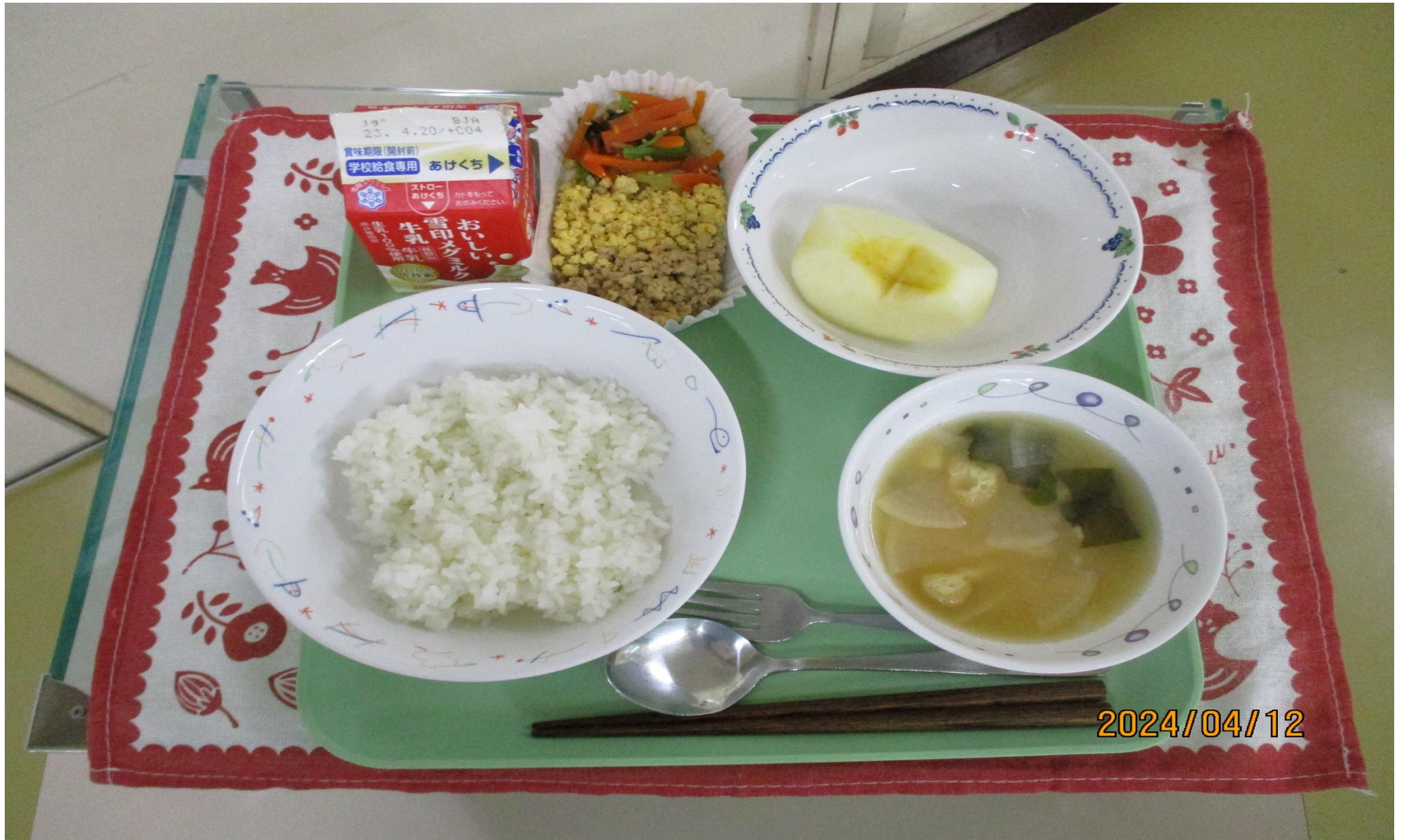
さんしょく どん だいこん しる くだもの 三色そばろ丼、大根とわかめのみそ汁、果物(りんご)