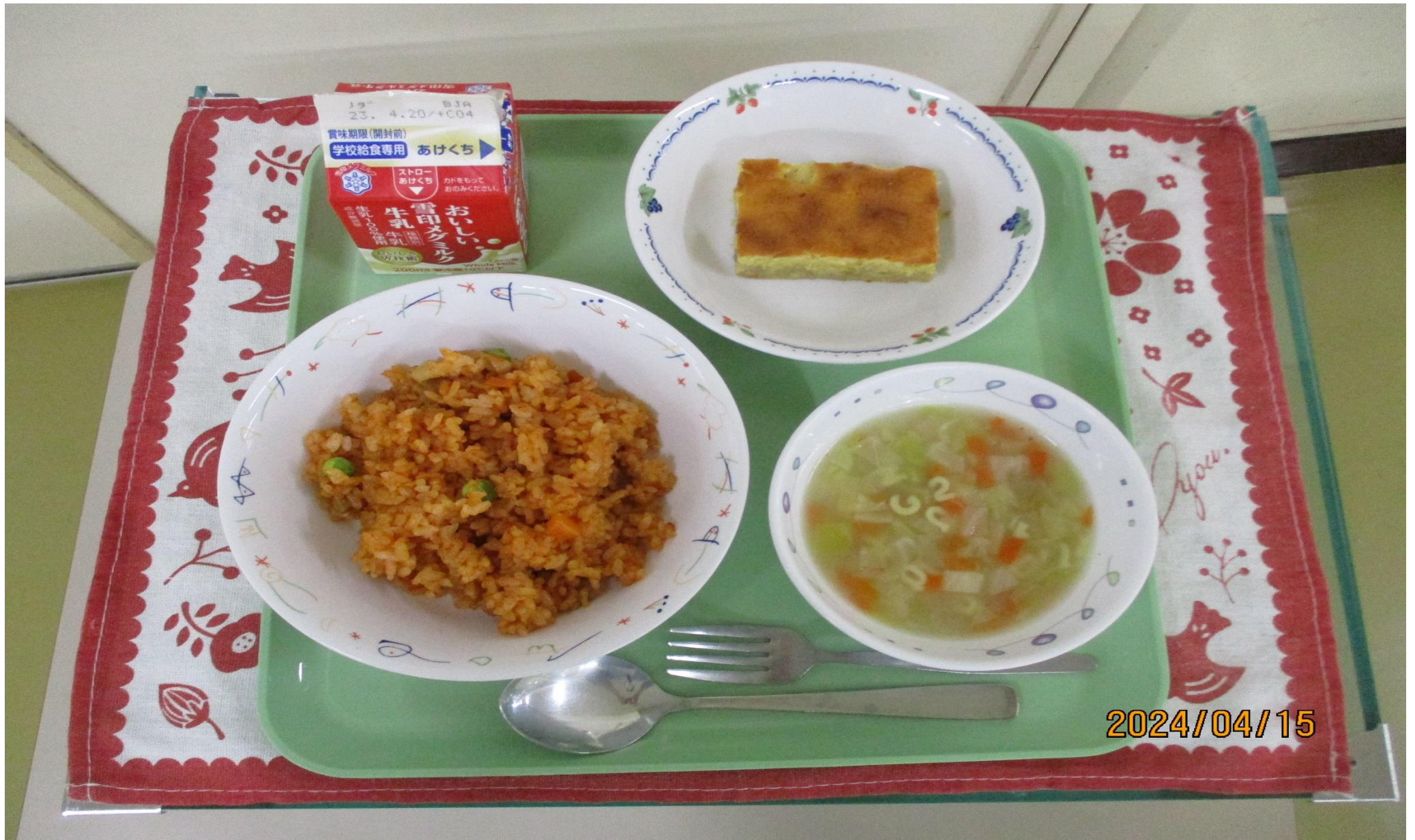
チキンライス、アルファベットスープ、バナナケーキ