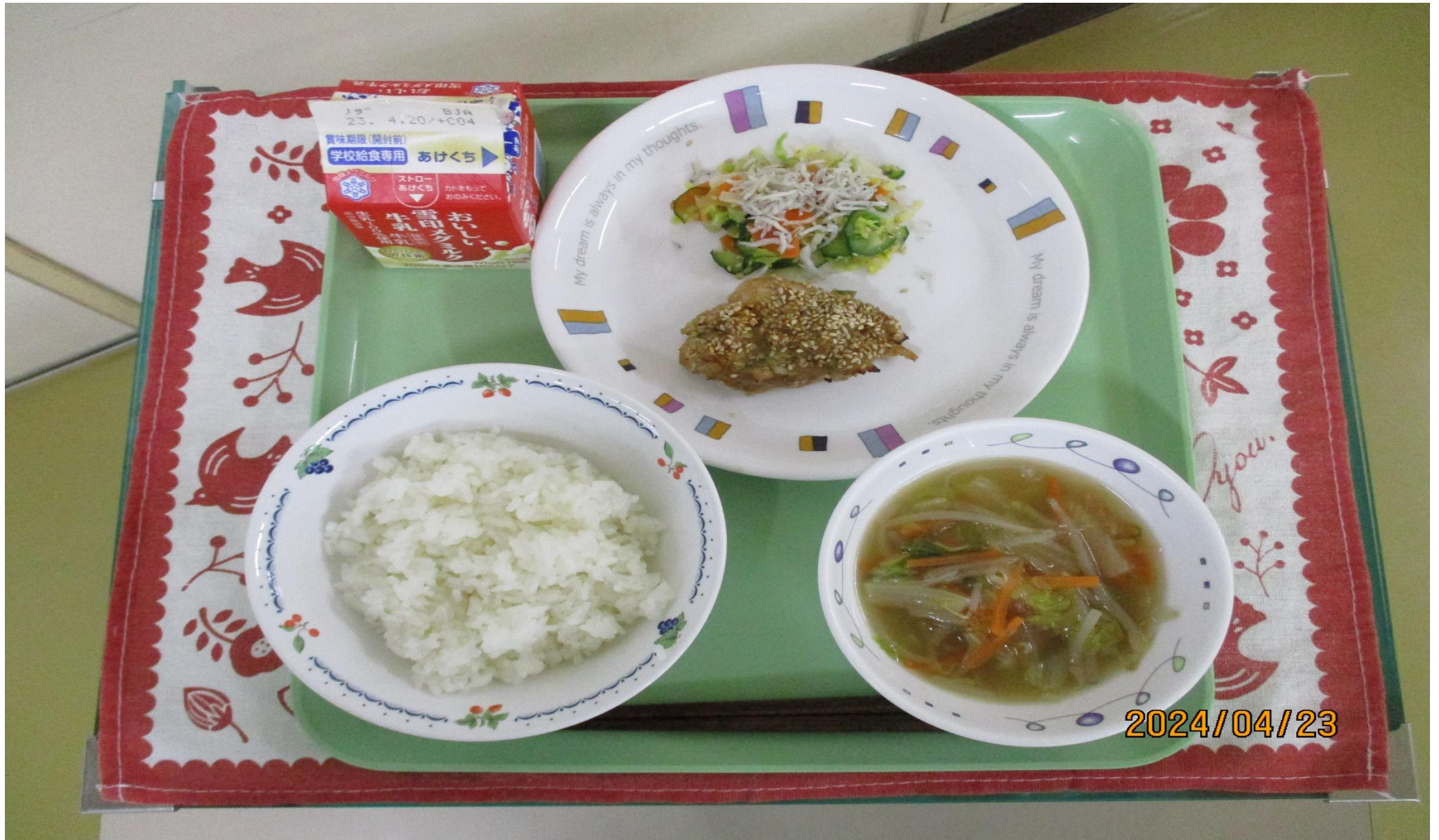
とりにく ごはん、 や 鶏肉のねぎソース焼き、しらすとキャベツのサラダ、 はるさめ 春雨スープ