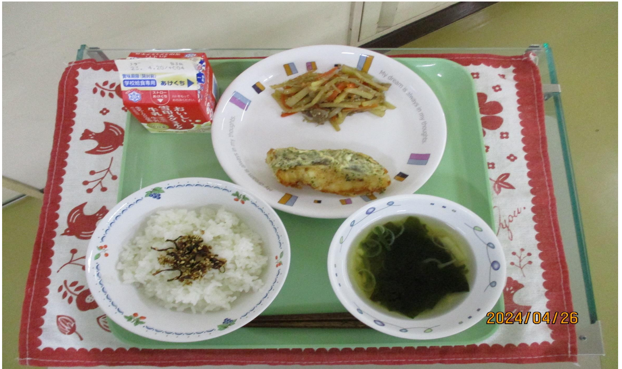
てづく さかな わかくさ わかたけじる ごはん、手作りふりかけ、魚の若草あげ、じゃがいものきんぴら、若竹汁