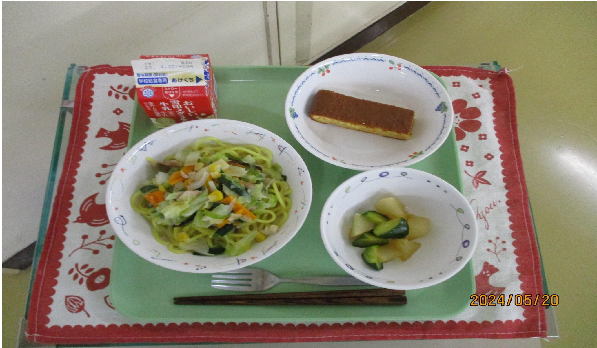
ながさき めん だいこん ちゅうかあ 長崎ちゃんぽん麺、きゅういと大根の中華和え、カステラ