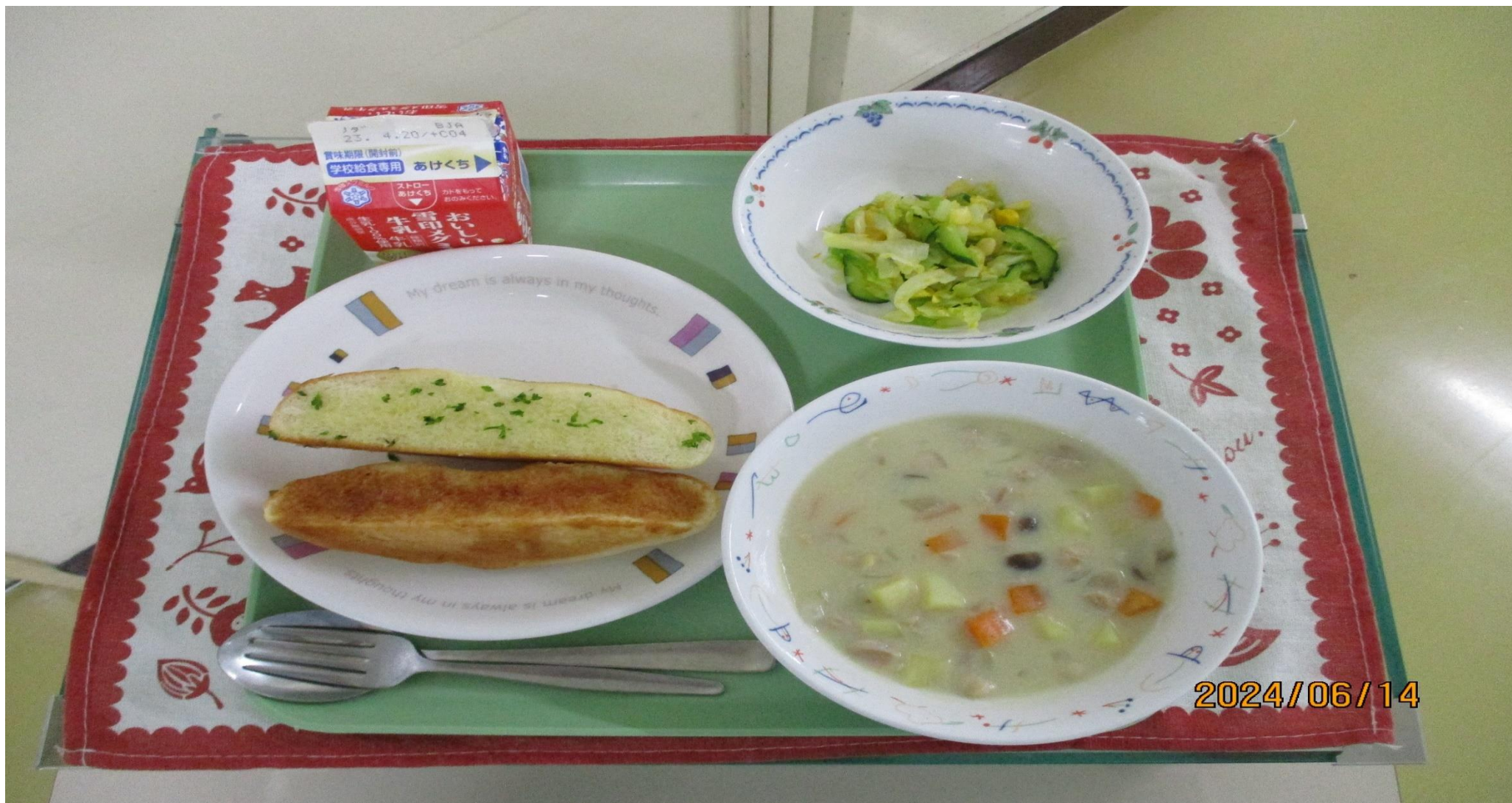
ガーリックとシナモンの2色 しょく フランスパン、 とうにゅう 豆乳シチュー キャロットドレッシングサラダ