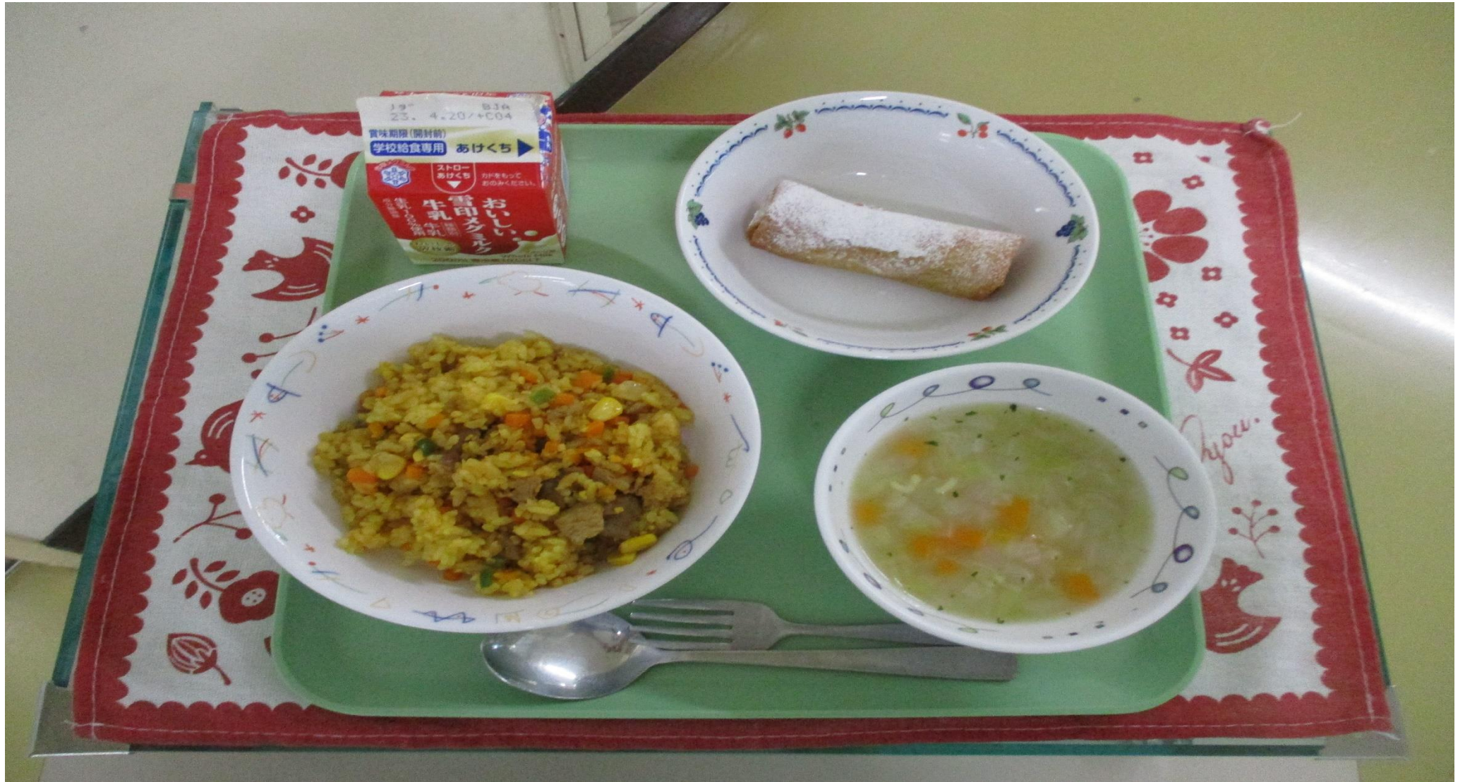
メキシカンライス、アルファベットスープ、バナナレンピア