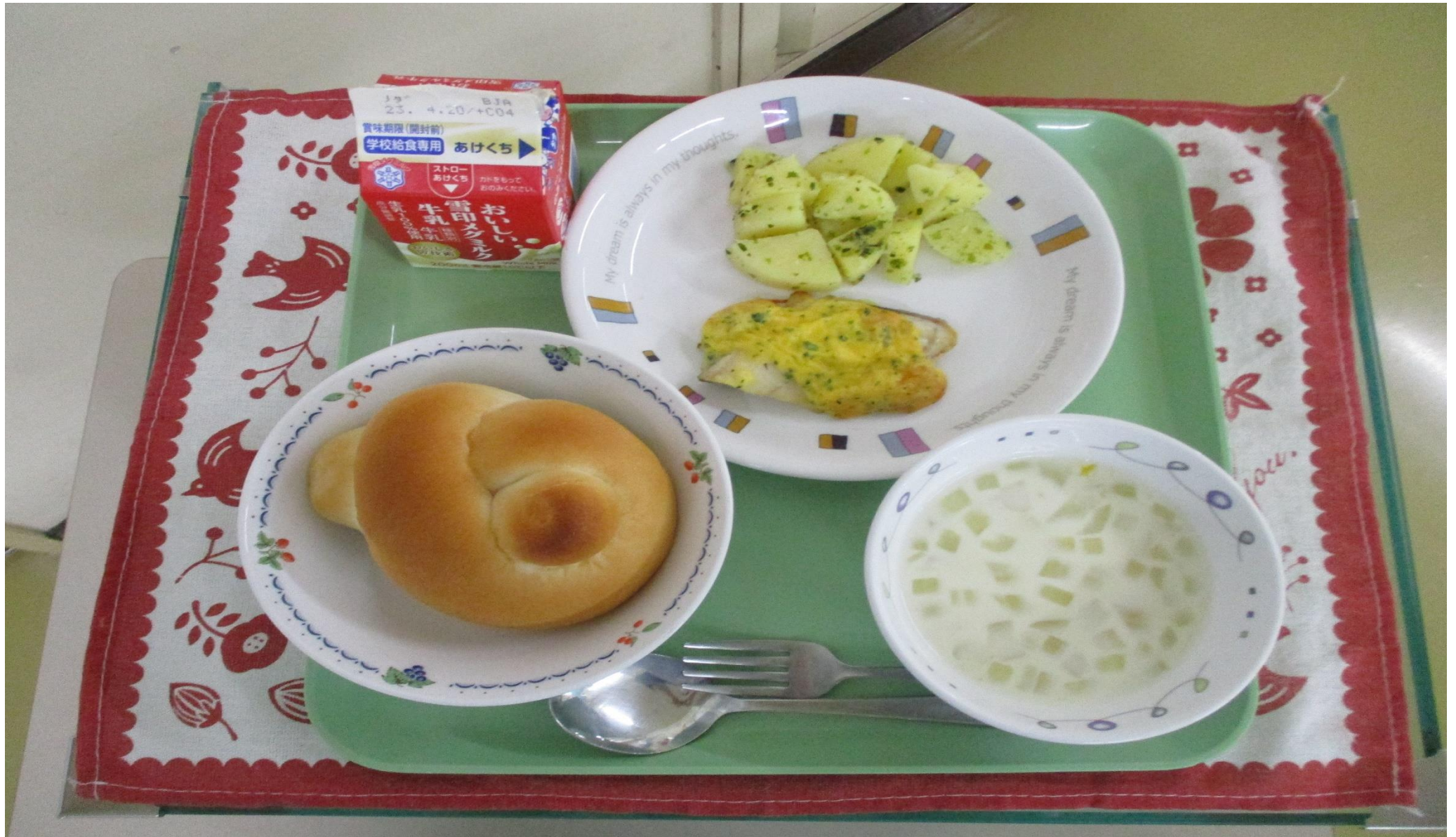
さかな ミルクパン、魚のピカタ、いも やさい こぶき芋、野菜のコーンクリームスープ