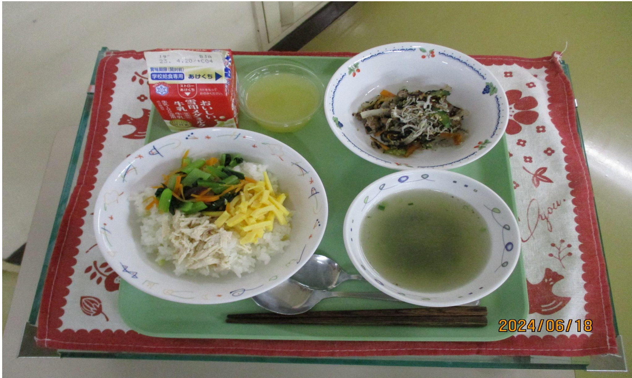
けいはん とり てっこつ 鶏飯、鶏がらスープ、鉄骨サラダ、パイんゼリー