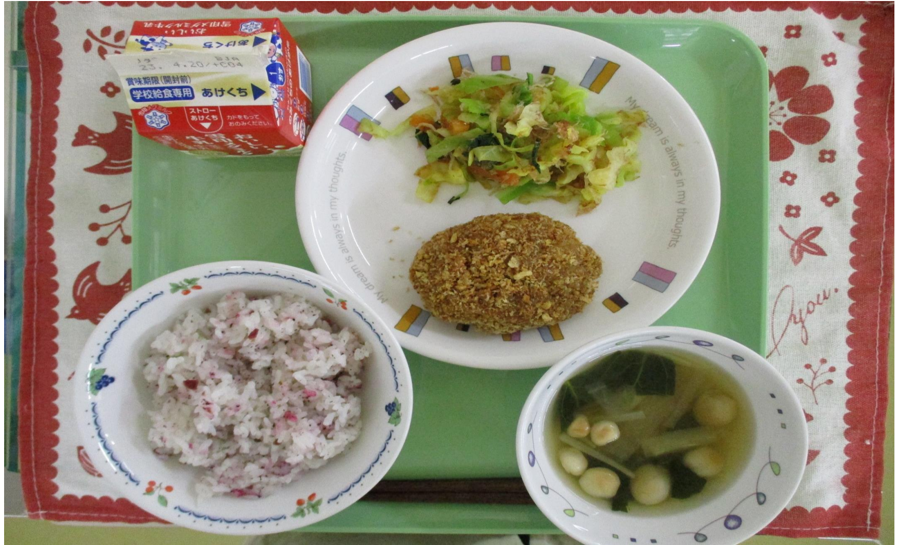
うめい 梅入りゆかいごはん、 にく 肉じゃがコロケ、 やさい ひた しらすと野菜のお浸し、 たまふ じる 玉麩のすまし汁