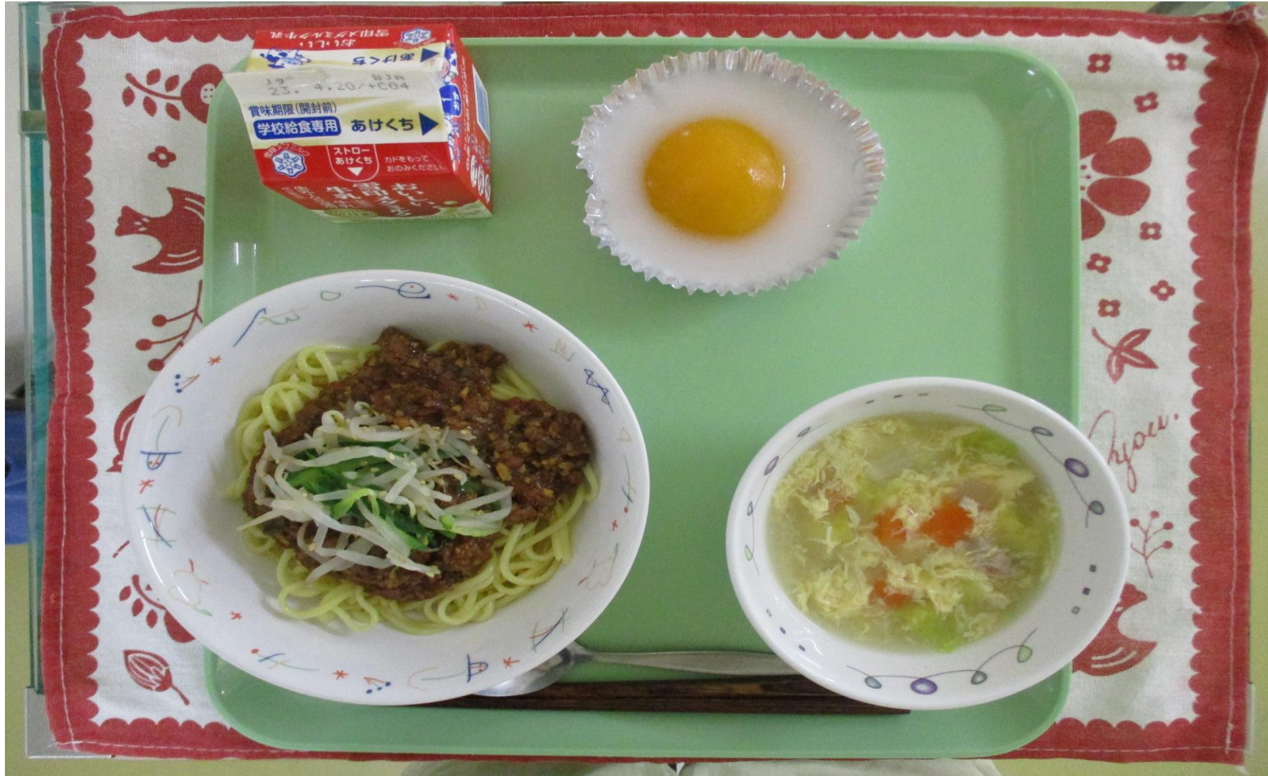
めん めだまや ジャージャー麺、たまごと野菜のスープ、おかしな目玉焼き