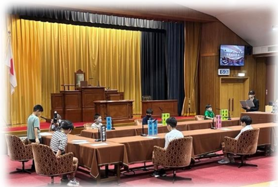
国会議事堂見学(6年生)