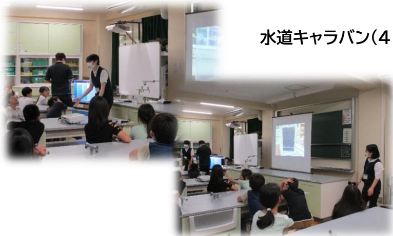
水道キャラバン(4年生)