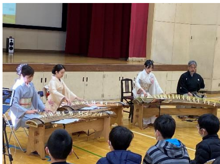
和楽器鑑賞教室(5年生)