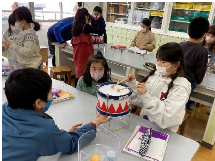
音の伝わり方 (3年生)