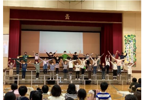
てっぺいちょうさ! すがたをかえる食べ物 (3年生)