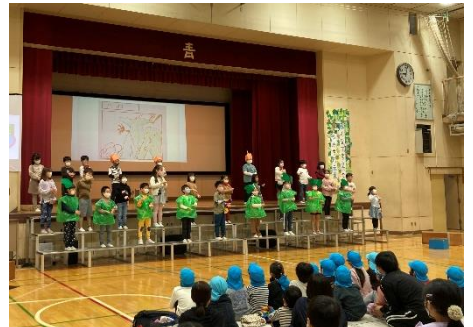
ぼくら 青山のまち たんけんたい (2年生)