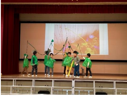
あさがおの あかちゃん につき (1年生)