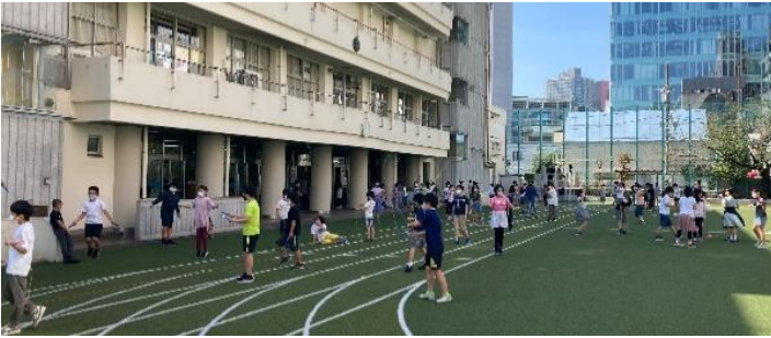
なわとび月間(休み時間の様子)