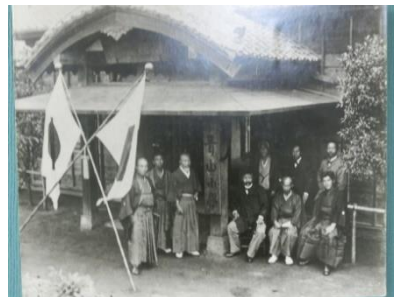
開校当時の青山小学校

青山小学校は11月5日に146歳の誕生日を迎えます。我が青小は、現存している小学校として港区内では最も古い学校の一つになりました。明治8年、今から146年前に、「教学院」というお寺の境内に校舎が建てられました。今の場所とは少し離れている、南青山三丁目交差点の郵便局あたりにありました。そして、同年11月5日に94名の児童をもって「公立青山小学校」は開校しました。学制発布が明治5年ですから、学校制度の黎明期にすでに青山小学校は産声をあげていたこととなります。明治39年には児童数増加と共に青南小学校ができ、分かれていきました。青山小学校は、「青山の地の本校」であり今もその歴史を刻み続けているのです。